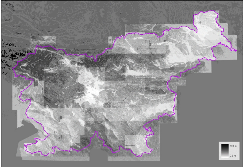
Slika 1: Potencialna višinska natančnost DMV 12,5, izračunana za vsako rastrsko celico. Takoj se vidi, da je model napak matematično težko opredeljiv.