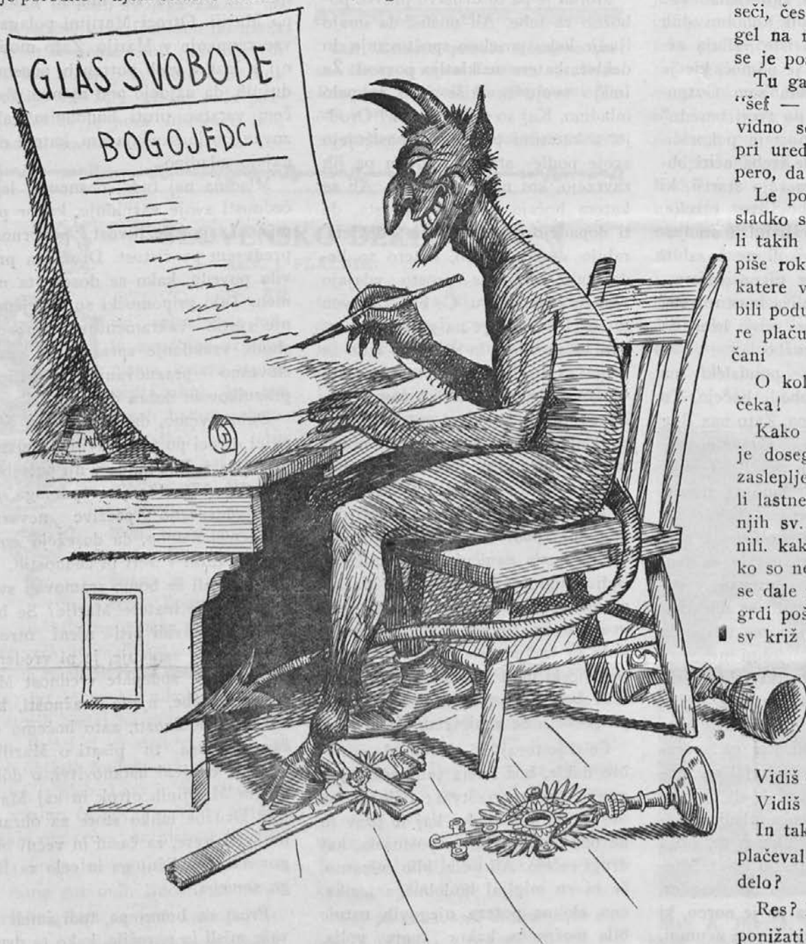
Nad - urednik naših protiverskih listov.