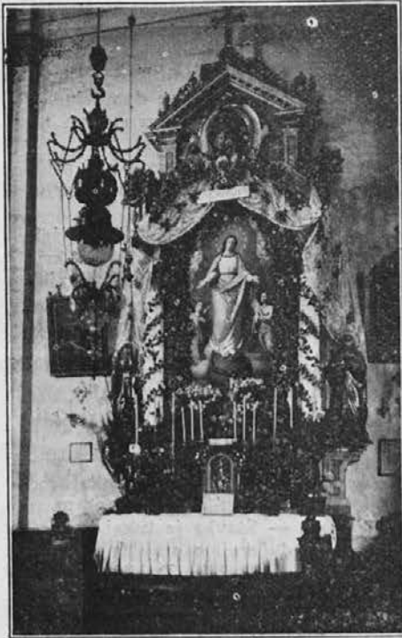
Altar Marijine Družbe v Semiču, na Dolenjskem.

Gotovo mislite, da so me boljseviki že dokraja dobili v svoje zanjke, ko Vam toliko časa nič ne pišem. Resnica je pa da je bilo veliko drugih vzrokov in zaprek, da se nisem preje oglašila. Imeli smo lani dvakrat moving biznes, bila sem tudi obakrat v številu kištarjev, da se je denar vedno za kaj drugega porabil. Ti ubogi urednik ti pa čakaj. No zdaj sem se pa spomnila na Vas... Pri-