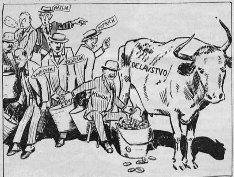
Slovenski delavski prijatelji pri njih delu za delavstvo.

Glenn Carnegie, Pa. — Čestiti g. urednik: Pošiljam Vam naročnino za list "Ave Maria," ker mislim, da je že potekla z mesecem decembrom. Dolžnost me sili, da se moram na tem mestu zahvaliti tudi za cenjeni list, ki me je obiskoval celo leto. Komaj čakam dneva, kdaj pride zlati "Ave Maria!" Upam, da me ne bo nikoli zapustil, ker bi se brez njega le težko živelo, posebno pa v