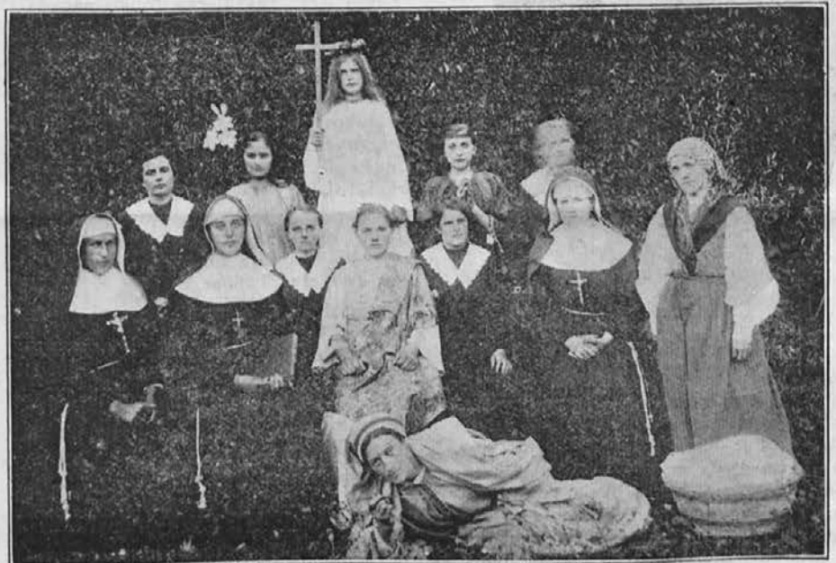
Dekleta Marijine Družbe v Semiču, na Dolenjskem v igri "Sv. Ludmila."

Odgovor: Santa Claus je pokvarjeno iz Saint Nicholas. Če Saint Nicholas hitro izgovarjate, kakor izgovarja pravi trdi Amerikanec, pa se bode res slišalo kakot nekaj Santa Claus. Amerikanski Santa ni nič drugega kakor naš navadni sveti Miklavž. — Da so svetega Miklavža pokvarili v "Santa Claus" si lahko razlagamo tudi iz tega, da se Angleži, koder je ta navada, hudi nasprotniki katoliške cerkve in torej tudi katoliških svetnikov. Sv. Miklavž je pa svetnik katoliške cerkve, Velik škof v Patari v Liciji v Aziji je bil, kjer je silno veliko dobrega storil za svoje vernike. Pred vsem je trem dekletom nekega meščana preskrbel dete, katero jim je ponoči vrigel skozi okno, kajti poročile bi se bile rade, pa njih oče ni imel primerne dote in jih je mislil že moralno prodati. Radi sovraštva Angležev do katoliške cerkve in katoliškega duhovništva si tudi lahko razlagamo, da so začeli na Angleškem mesto našega pravega sv. Miklavža v škofovi obleki slikati ga kakor starega moža z veliko sivo brado. Prestavili so ga tudi s 6. decembrom na Božič. — Da ga slikajo z dimnikom pa izvira iz tega, ker so mu na Angleškem nastavljali na "mantle piece" poleg ognjišča. Otroci so tja obešali svoje od snega zmočene nogavice, da so se posušile do jutra in stariši so kar v te nogavice devali darove in so rekli otrokom, da je ta Santa Claus prišel skozi dimnik v hišo in tam napolnil nogavice z darovi.