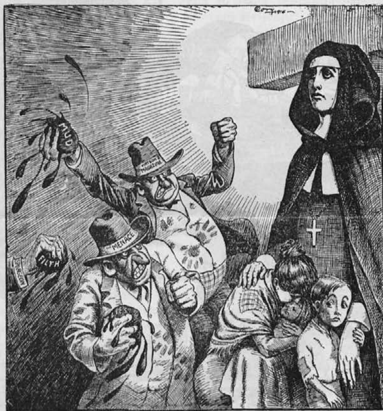
Takole delajo "naši nasprotniki."

Apostoli dali so to oblast svojim naslednikom: škofom in duhovnikom. Posvečevali so jih, pokladali na nje svoje roke, davali jim urad in isto moč, ki so jo prejeli od Gospoda: oznanjati besedo Božjo, krščevati, opravljati daritev sv. maše, deliti sv. poslednje olje in odpušča-