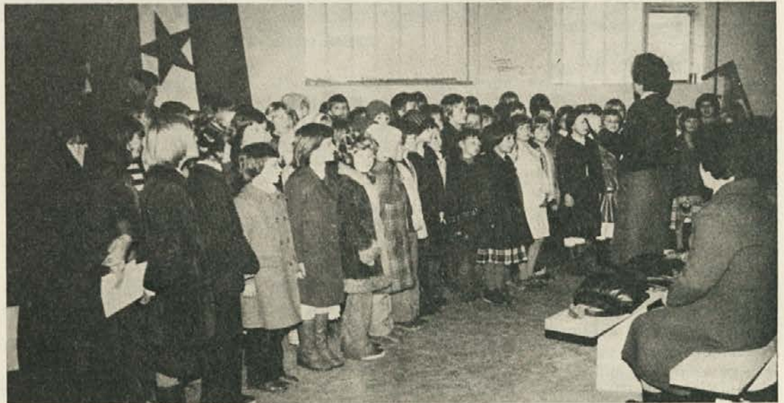
Nastop otroškega pevskega zbora iz OŠ Franja Goloba