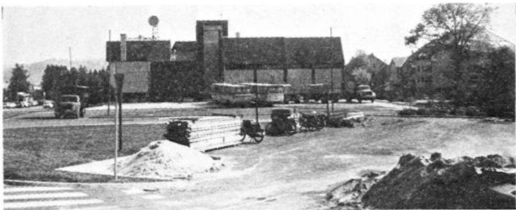
Med pomembnimi nalogami je brez dvoma tudi izgradnja avtobusne postaje v občinskem središču

Novi programi bodo zagotavljali tudi delovna mesta, ki bi naj bila zaradi zahtevnejših programov in sodobnejše opreme pretežno na višji tehnološki ravni in s tem produktivnejša. V letu 1987 bi naj zaposlili okrog 110 delavcev, med njimi bi naj bili predvsem strokovnjaki, večji pomen pa je potrebno dati tudi strokovni rasti že zaposlenih de-