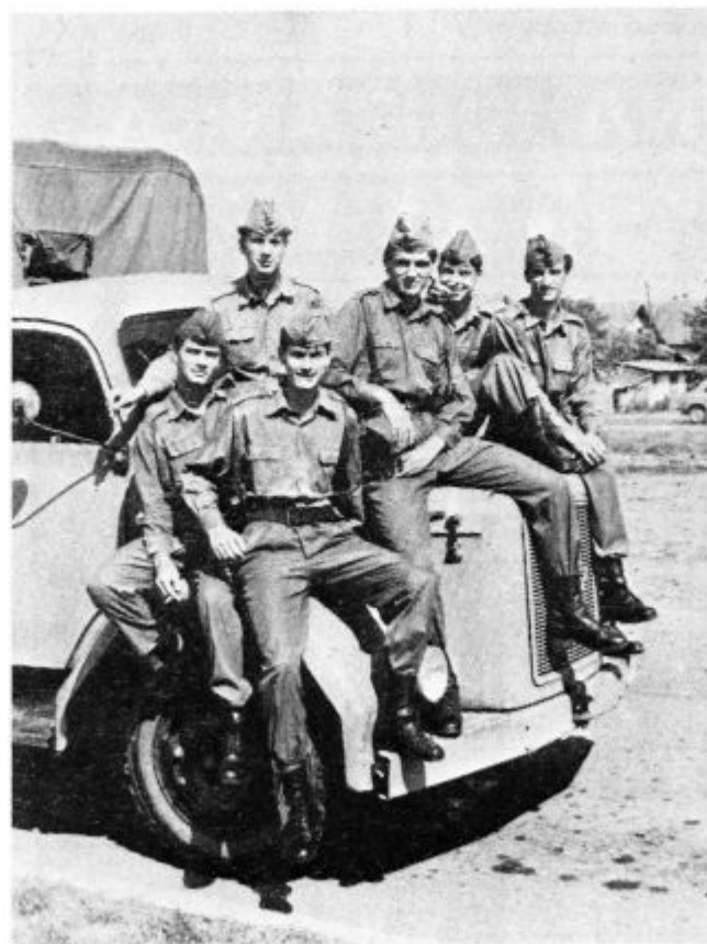
Skupina bodočih starešin JLA