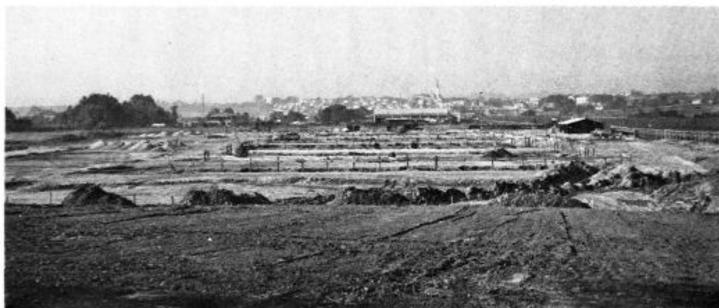
Takšen je bil pričetek gradnje hladilnice pri Lenartu