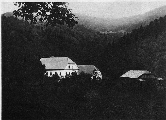
Tavčarjev dvorec Visoko v Poljanski dolini.

PRISPEVAJTE V FOND ZA AKADEMIJO ZNANOSTI IN UMETNOSTI IN ZA NARODNO GALERIJO V LJUBLJANI!