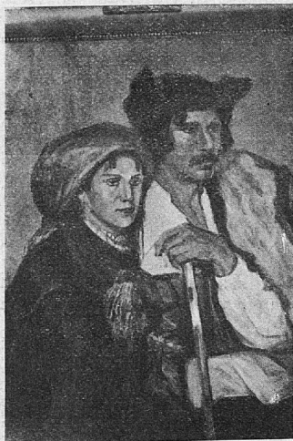
Pero in Olena.

Nekaj povsem novega je tudi običaj tega naroda, kadar leži mrlič na mrtvaškem odru. Tedaj se ti našemi par moških, spači lice ali natakne krinke in brijejo ti norca, plešejo in zabavajo mrtveca vse do ranega jutra.