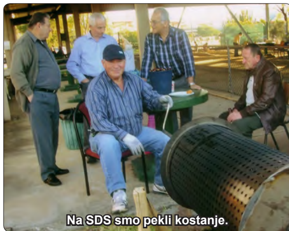
Na SDS smo pekli kostanje.

Slaba novica za nas Slovence je, da smo izgubili naš SBS v slovenskem jeziku. Sedaj imamo na voljo samo eno uro in to ob petkih ob petih popoldne. Veliko ljudi mi pravi, da sploh ne morejo poslušati slovenske oddaje. Odgovorim jim, da morajo kupiti digitalni radio ali televizijo, potem pa bodo lahko ob petkih slišali slovensko oddajo na digitalni televiziji Radio SBS 3. Nekdo mi je rekel, da je kupil digitalni radio. Enkrat ga je slišal, drugič pa ni več delal. Seveda, ko kupite najcenejši kitajski model, potem pa se pokvari! No, vidite, prej ni bilo veliko zanimanja za radio v slovenskem jeziku. Spraševal sem rojake: Ste poslušali našo oddajo. Ne! Saj smo te novice že slišali prejšnji teden po televiziji. Pa sem moral biti tiho. No sedaj pa radio posluša še pol manj ljudi. Taki smo Slovenci. Raje podpiramo tuje klube, samo slovenskih ne. Mi, Slovenci v NSW, imamo sedaj lastne