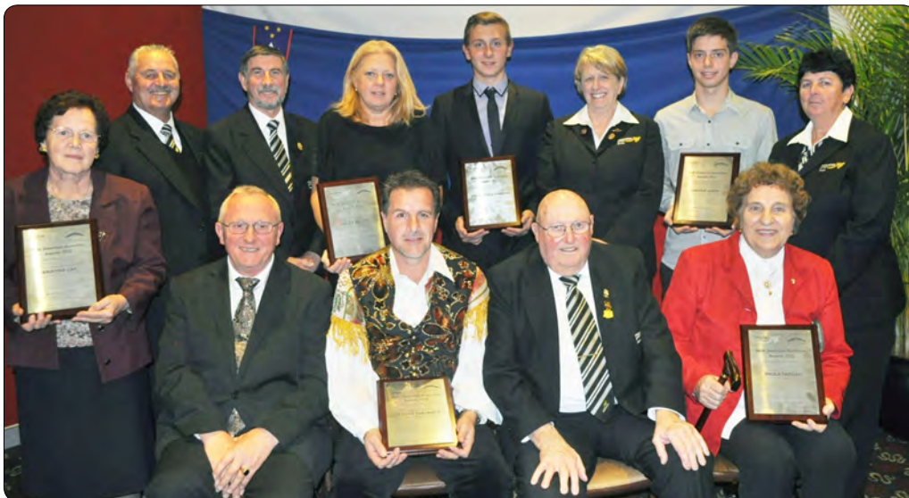
Zmagovalci in dobitniki priznanj za njihovo zaslužno delo v letu 2012 skupaj z odborniki Kluba Mounties in Kluba Triglav.

kulturnem središču sv. Cirila in Metoda v Kew v Melbournu.