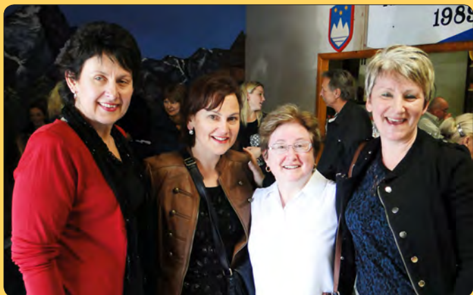
AKOV V JUŽNI AVSTRALIJI 18.08.2013