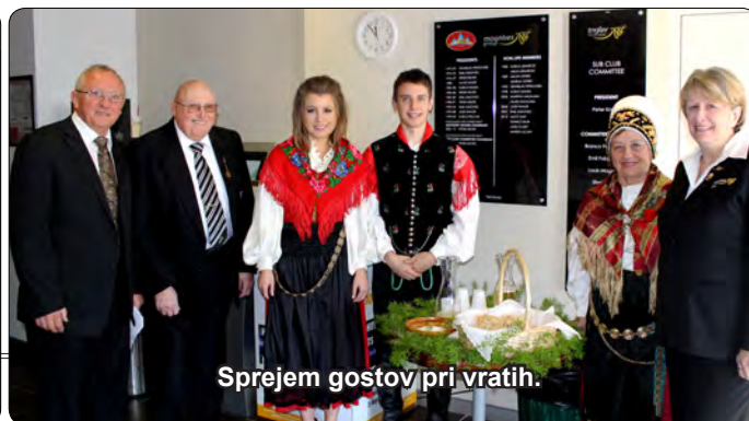
Sprejem gostov pri vratih.