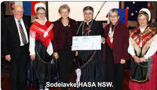
Sodelavke HASA NSW.