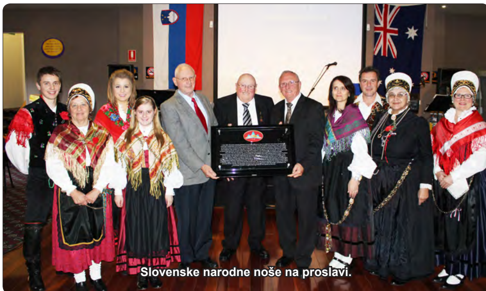
Slovenske narodne noše na proslavi.