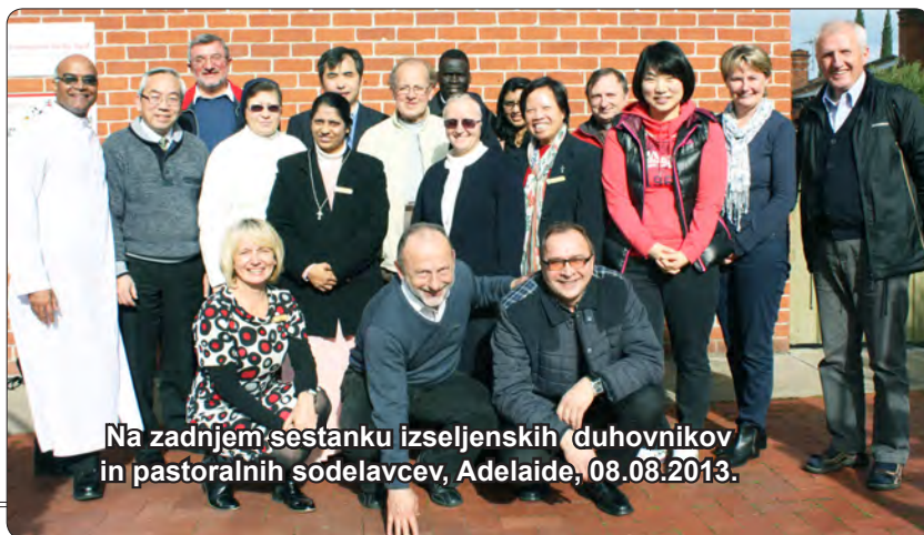
Na zadnjem sestanku izseljenskih duhovnikov in pastoralnih sodelavcev, Adelaide, 08.08.2013.