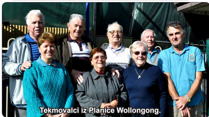
Tekmovalci iz Planice Wollongong.