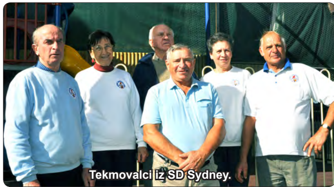
Tekmovalci iz SD Sydney.