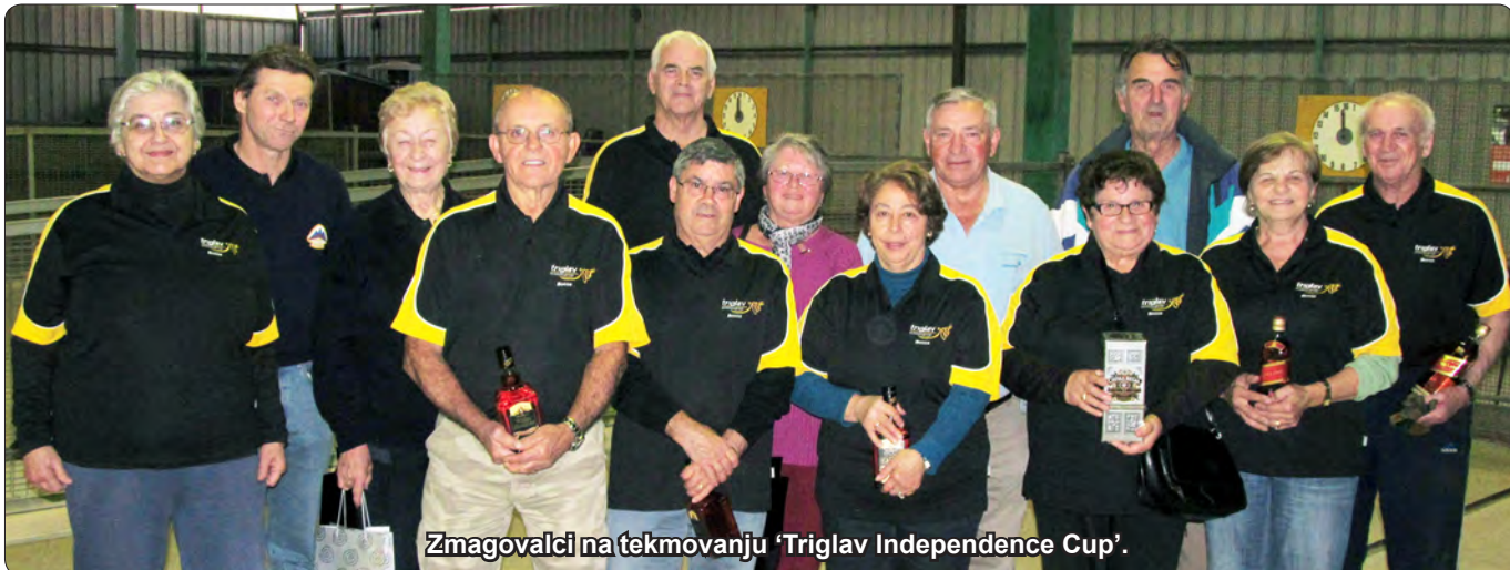
Zmagovalci na tekmovanju 'Triglav Independence Cup'.

Triglav klub, prijetno in prijazno vzdušje in disciplina pri tekmovanjih. Ob vsakem tekmovanju je na razpolago tudi brezplačna kava ali čaj s pecivom ali piškoti, klub pa tudi veliko prispeva k ceni nedeljskih večerij, tako, da večina balinarjev plača samo simbolično ceno $6.00 za nedeljsko balinanje z večerjo. V sedanjem hladnem zimskem času so na razpolago tudi plinske peči za gretje, tako, da balinarjev in obiskovalcev ne zebe, ko posedijo ob mizah pri baliniščih ali v urejenih družabnih odprtih prostorih na notranji terasi pri otroškem igrišču. Dobrodošel je vsak in vsi !