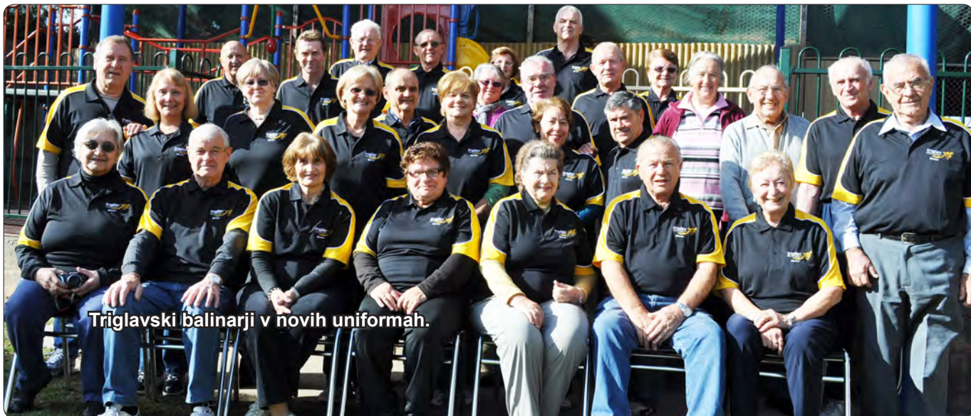
Triglavski balinarji v novih uniformah.