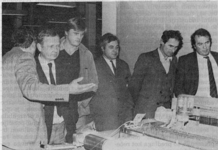
Člani delovne skupine so si po razgovoru ogledali tudi naše proizvodne obrate