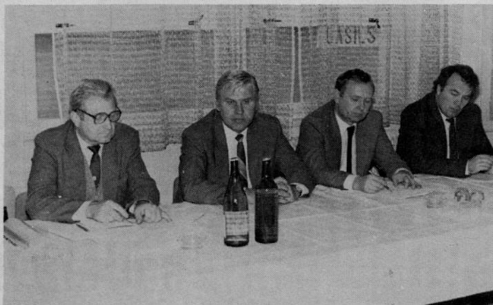
Delovna skupina CK ZKS ob razgovoru v naši DO