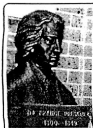
Doprsni kip Franceta Prešerna, patrona SDS, v veži društva

Žive naj vsi narodi, ki hrepene dočakat dan, da, koder sonce hođi, prepir iz sveta bo pregnan da rojak prost bo vsak, ne vrag, le sozed bo mejak!