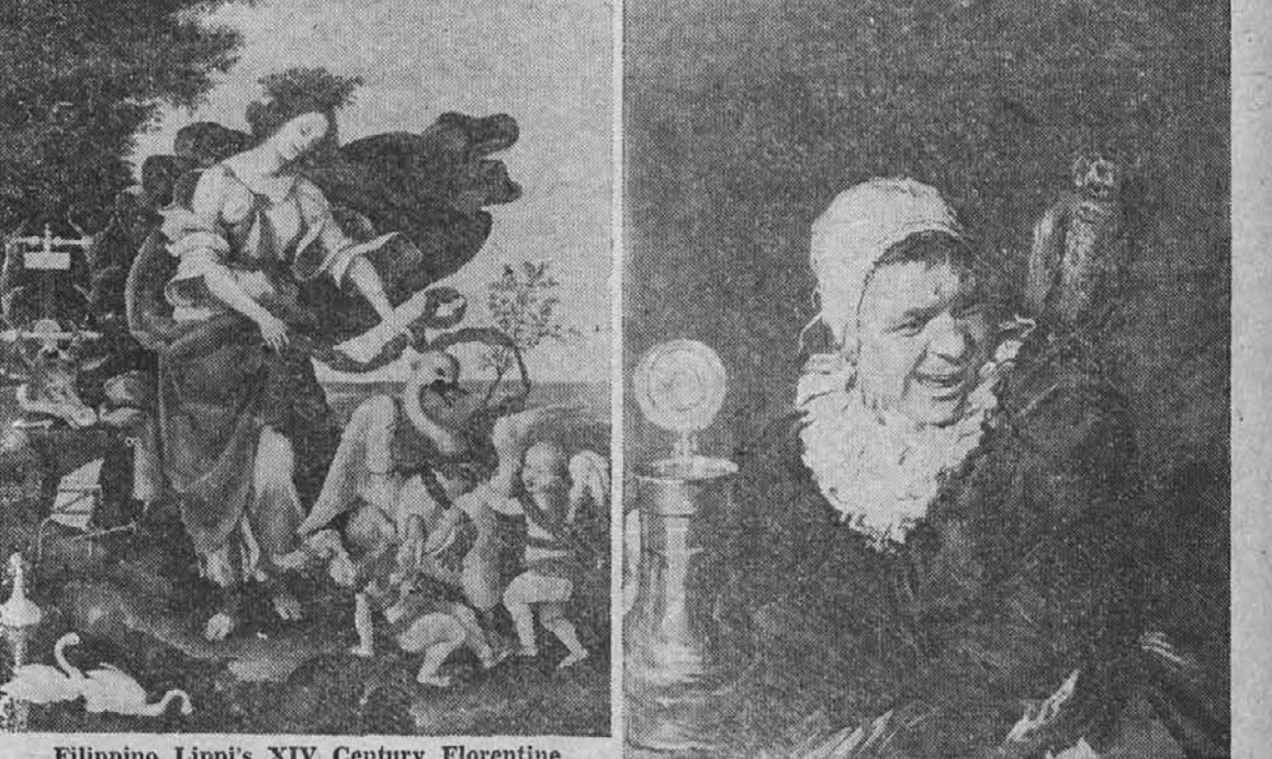
Filippino Lippi's XIV Century Florentine "Allegory of Music" and Frans Hals' "Witch of Haarlem"

Na razstavi umetniških slik, ki jo bo priredil Cleveland Museum of Art od 6. do 22. oktobra, se bo nahajala tudi krasna florentinska slika Filippina Lippija "Alegorija Glasbe."