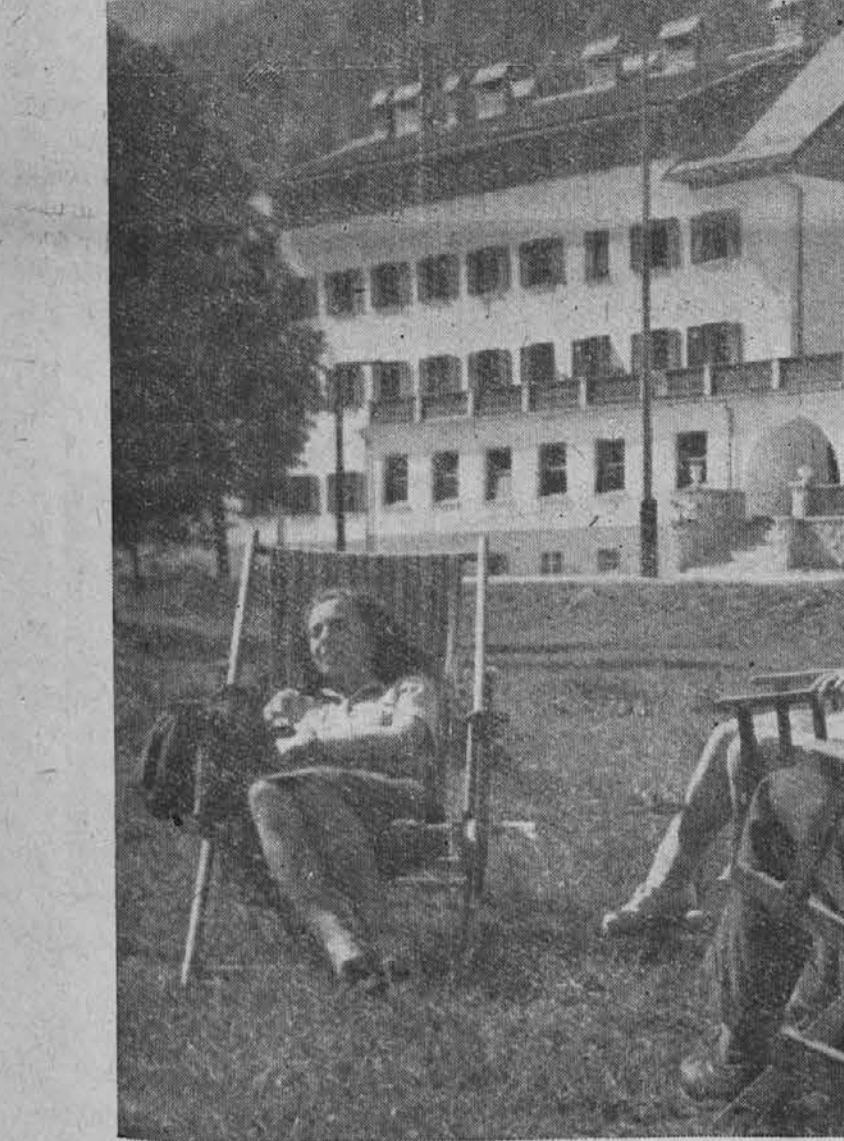
Počitniški dom v gozdu Martuljku

"Kaj naj ti povem? Pogovori se z gosti in pa..."