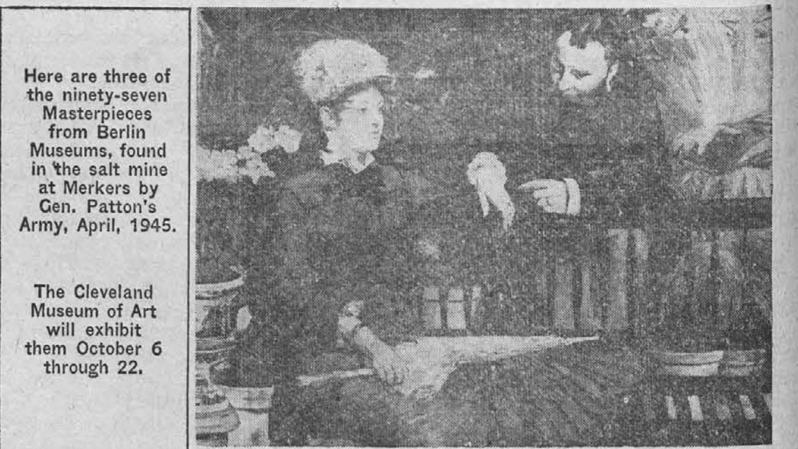
Most modern, "The Greenhouse" by Edouard Manet