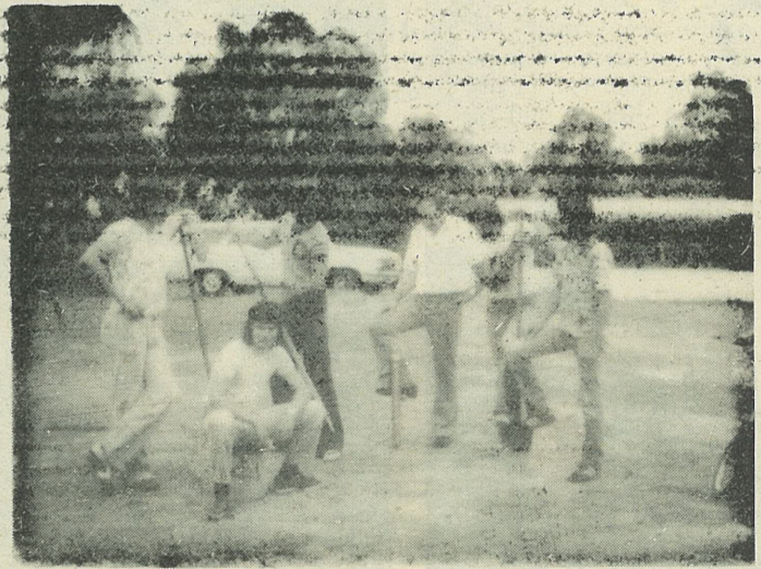
Big decision — which step should we take next?