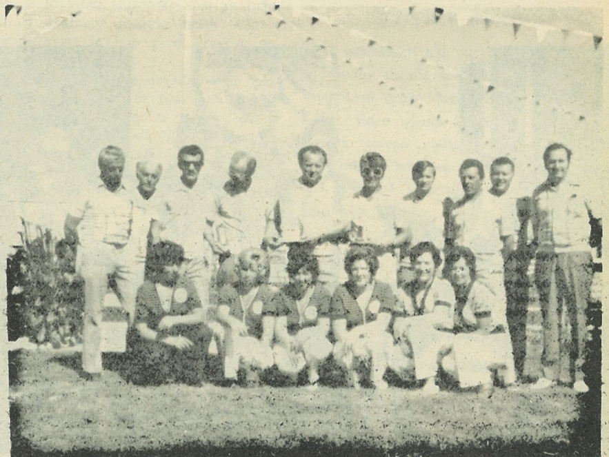
Balinarska ekipa "Planice"