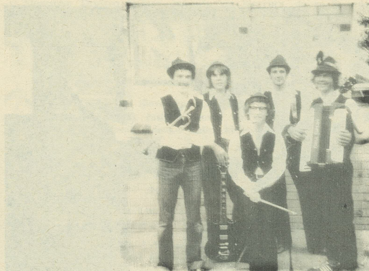
VELENJE — želi mnogo veselja in sreče za božične praznike in uspeha polno Novo leto 1978!