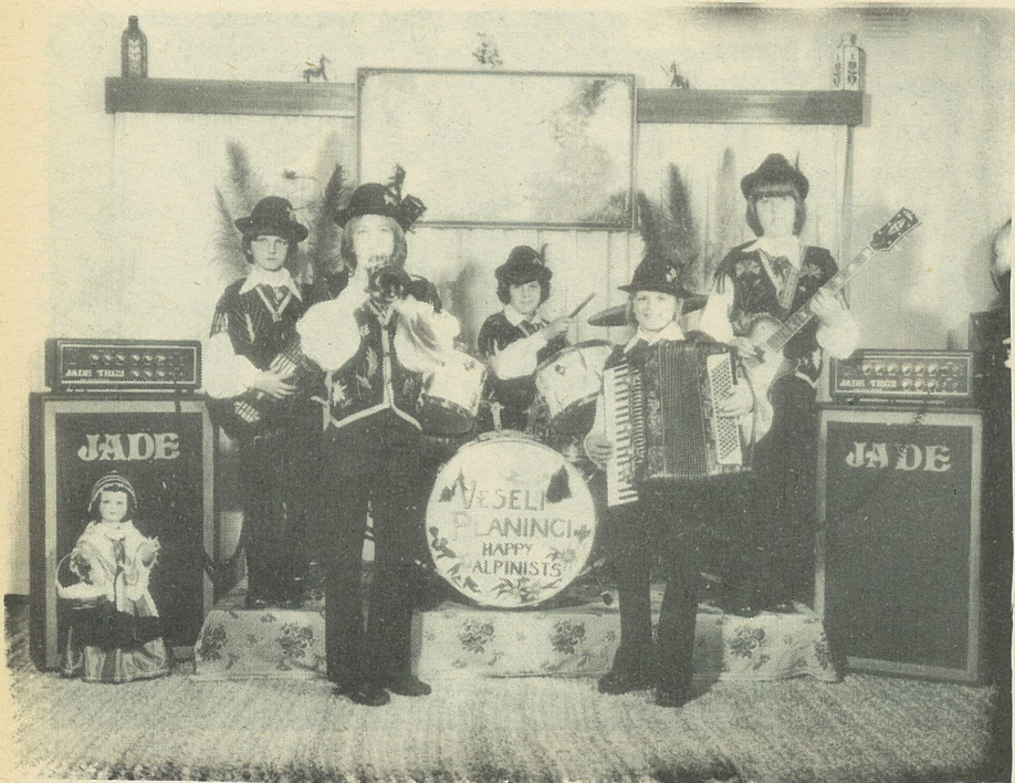
VESELI PLANINCI — pozdravljajo vse ljubitelje mu- zike in jim želijo obilo zdravlja in veselja ob praznikih!