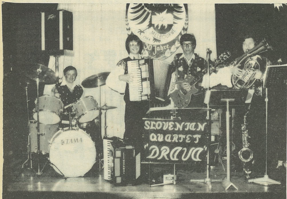
Slovenski kvartet "DRAVA" želi vsem VESEL BOŽIČ IN MNOGO VESELJA V NOVEM LETU. Melbourne Tel. 798 4824, 306 9503