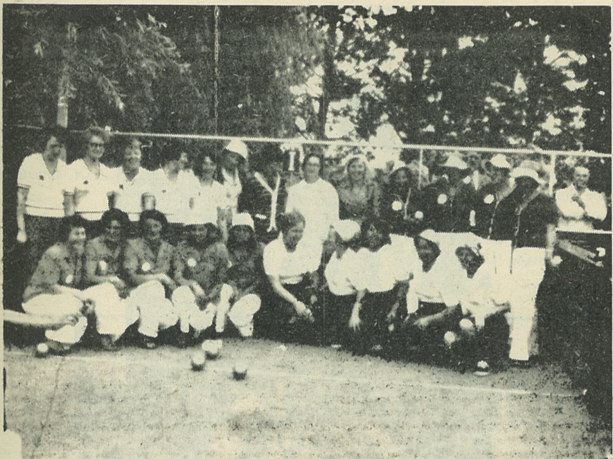
Od leve proti desni ženske ekipe društev — prva vrsta: Jadran in Geelong, druga vrsta: Planica Canberra, S.D.M.