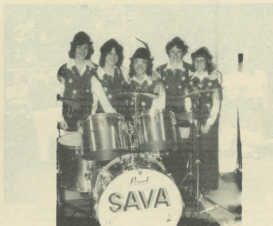
ANSAMBEL "SAVA" želi vsem čitateljem "Vestnika" Vesel Božič in Srečno Novo Leto.