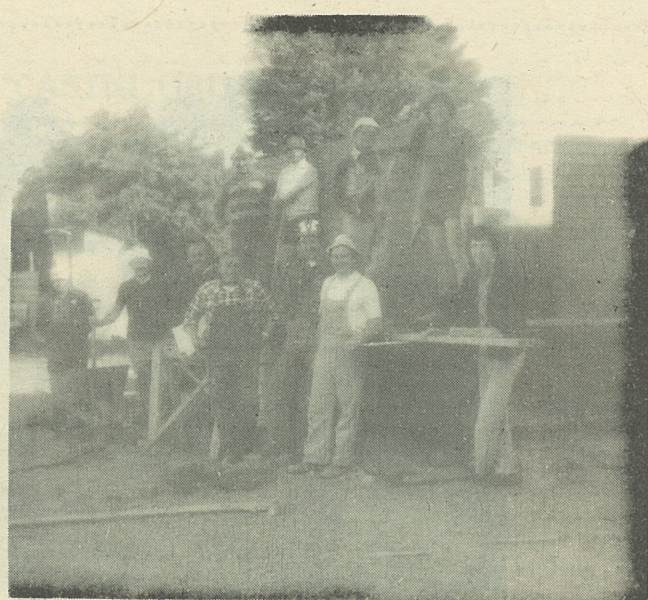
S skupnimi močmi se vse hitro zgradi — pri gradnji toaletnih prostorov na Planici v Springvalu