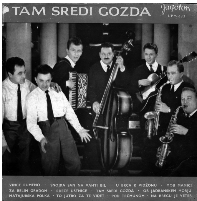
Slika 2: Beneški fantje leta 1963 v kostumih, krojenih po sočasni modi [naslovnica z velike plošče].

Odločitev Ansambla bratov Avsenik za različico narodnih noš niti ni presenetljiva, saj so se tako že ob koncu 19. stoletja oblačile skupine pevk in pevcev [Knific 2002: 9], podobno pa je bilo tudi z inštrumentalisti. Presenetljivo ni niti to, da je Ansambel bratov Avsenik za osnovo kostuma vzel gorenjsko narodno nošo, saj so imeli sedež na Gorenjskem, poleg tega pa je bila gorenjska narodna noša že takrat močno uveljavljena skoraj povsod po Slovenskem in je veljala za nekakšno »narodno uniformo« oz. »nacionalno preobleko«.