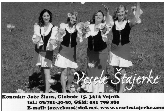
Slika 7: Vesele Štajerke na koledarju za leto 2004. Sodobno krojena oblačila s pridihom tradicije [Letni koledar 2004].