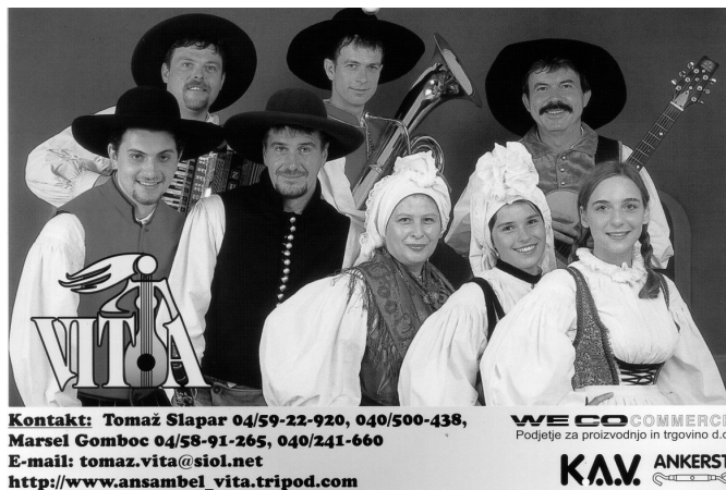
Slika 5: Ansambel Vita v kostumih, ki so si jih sposodili pri folklorni skupini Triglav iz Slovenskega Javornika in Karavanke iz Tržiča.

Čas od začetkov delovanja Ansambla bratov Avsenik pa do danes je v zvezi z oblačilno kulturo vsekakor prinesel kar nekaj sprememb in narodna noša se danes večini članov narodno-zabavnih ansamblov ne zdi več tako udobna, kakor se je v začetku zdela Vilku in Slavku Avseniku, zlasti pa ni prilagojena toplotnim razmeram v različnih letnih časih. Nosilci kostumov za poletne mesece (tudi pozimi na nastopih v notranjih prostorih) poudarjajo problematičnost pokrival, npr. klobukov, navsezadnje tudi zato, ker jih moški danes niso več vajeni nositi. Ženske se pokrival izogibajo iz več razlogov: če imajo glave pokrite, slabo slišijo in zato težje pojejo, z njimi se ne počutijo dobro; zdi se jim, da kvarijo njihov videz, poleg tega pa jim je pod njimi tudi vroče. Na zimskih nastopih na odprtih prostorih imajo nasprotno težavo. Narodna noša, kakršna se je izoblikovala v zadnjih desetletjih pri narodno-zabavnih ansamblih, ne pozna toplih vrhnjih oblačil, zaradi česar na nastopih kdaj pa kdaj čez nošo oblečejo sodobno krojena vrhnja oblačila (budne, plašči ipd.).