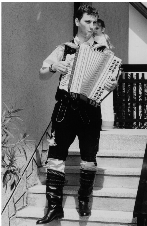
Slika 9: Godec na diatonično harmoniko na ohceti v Trbovljah.