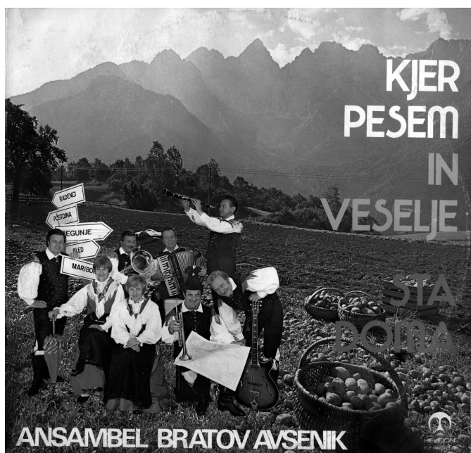
Slika 3: Ansambel bratov Avsenik na veliki plošči leta 1976.

Poseben pomen je imela njihova kostumska podoba pri nastopih v tujini, saj so bili, oblečeni v narodne noše, razpoznavni med drugimi tujimi skupinami. Sčasoma je tak odrski oblačilni videz postal neke vrste sinonim za narodnozabavno oz. „oberkrainarsko“ muziko [Sivec 2002: 290]. Sivec zato pravilno ugotavlja, da so se sprva člani Ansambla bratov Avsenik oblačili podobno kot ljudski godci (v oblačila, krojena po sočasni modi), pozneje pa so delno stilizirano 'narodno nošo' prikrojili še bolj po svoje in s tem ustvarili neko normo, ki so se je držali tudi drugi narodnozabavni ansambli skorajda brez pomislekov [Sivec 1999: 160].