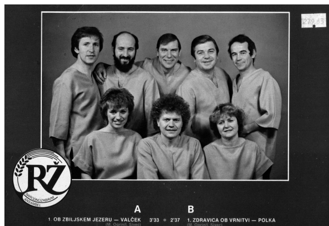
Slika 6: Člani ansambla Rž na svoji prvi veliki plošči leta 1980 v kostumih, ki predstavljajo odmik od narodnih noš, v njih pa so vseeno opazni elementi oblačilne dediščine.

Kljub negativnim izkušnjam z oblačenjem v sodobnejše krojene kostume na tujem v zgodnejših letih razvoja narodno-zabavne glasbe si tudi v sodobnosti nekateri ansambli prizadevajo, da bi se po kostumski podobi razlikovali od začetnikov narodno-zabavne glasbe. V tem pogledu so inovativnejši mlajši ansambli, ansambli, ki nimajo sedeža na Gorenjskem, in ansambli, ki ne hodijo veliko v tujino. Organizatorji koncertov v tujini namreč še danes pogosto zahtevajo, da so ansambli na nastopih oblečeni v narodne noše. Željo po sodobnejši interpretaciji oblačilne dediščine oz. izdelavi kostumov, ki bi upoštevali sodobne težnje in hkrati spominjali na preteklost (tudi slovenskost), je mogoče opaziti pri nekaterih mlajših narodno-zabavnih ansamblih, ki jih sestavljajo mlada dekleta (npr. pri Veselih Štajerkah).