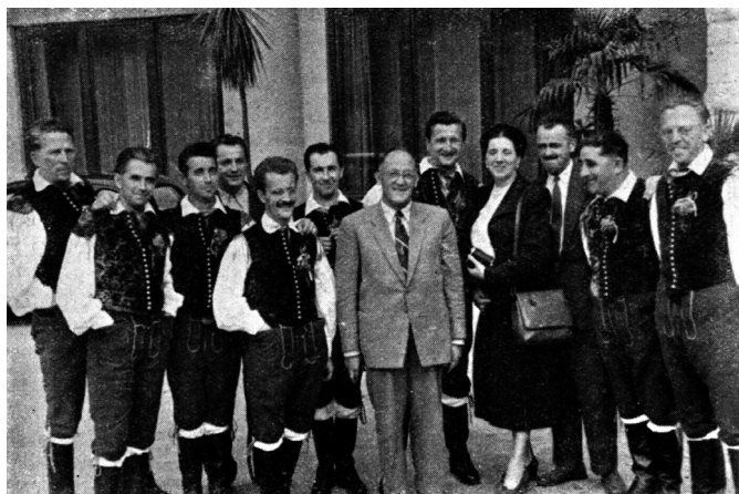
Slika 1: Člani Slovenskega okteta so se za nastope v tujini praviloma oblačili v t. i. narodno nošo. S turneje po ZDA: Slovenski oktet prireja rojakom na obisku koncerte [Seliškar (ur.) 1954: 163].

Avsenik, ki se je za na tradiciji temelječe kostume zavestno odločil kmalu po nastanku in pri tem vztrajal vsa leta svojega delovanja.