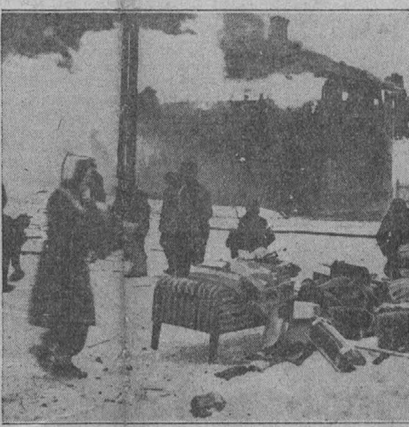
Na sliki je videti goreče hiše finskega kraja Vaase, ki so ga bombardirali sovjetski letalci. Ljudje iznašajo iz gorečih hiš svoje potrebščine, dasi tvegajo pri tem svoje življenje.