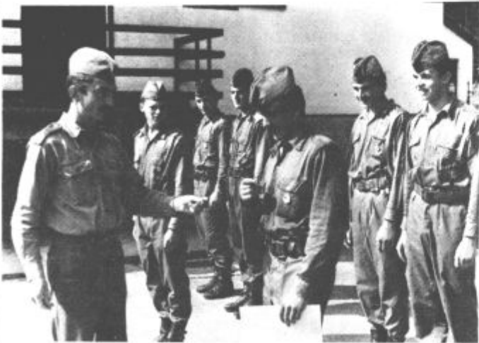
Značka »vzornega vojaka« je zagotovo na pravih prsih