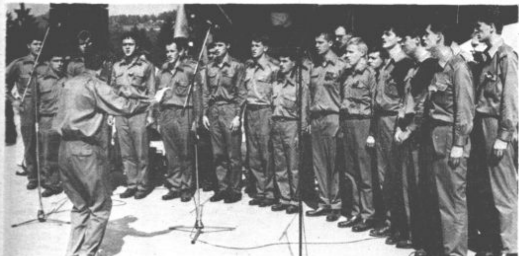
Združeno: sta nastopila tudi pevski zbor in ansambel vojakov iz Ljubljane, ki so prav tako ogreli dlani gledalce