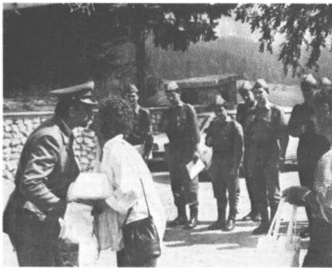
Prijetna čestitka in zaslužen darilo

V petek so slavili svoj praznik vojaki, ki budno, odgovorno in z neomajno voljo varujejo nedotakljivost meja naše domovine. Slovesno je bilo tudi v obmejnih postojankah v Logarski dolini in v Podolševi. Obiskali so jih predstavniki družbeno-politične skupnosti, javne varnosti, JLA in drugi, vsem skupaj pa so se kasneje pridružili še domačini, ki so neločljiv sestavni del varnosti državne meje. Vsi skupaj so se zadržali na tovariških srečanjih, vojake pa so gostje pozdravili, jim čestitali in se jim zahvalili za uspešno izvrševanje zahtevnih in odgovornih nalog ob državni meji z avstrijsko republiko. Izročili so jim še priložnostna darila, vojaki pa so se jim oddolžili z vedno dobrim in okusnim vojaškim pasuljem. Slavje je minilo v prijetnem vzdušju in zadovoljstvu ob izjemnih uspehih vojakov, tudi pri vzornem urejanju svojih postojank, ki so lahko vsakomur za zgled, za vse skupaj pa so v petek prejeli vrsto visokih priznanj, tudi republiško in zvezno, v njihovih vrstah je od petka dalje še več tistih z značko »vzornega vojaka«, pa tudi prejemnikov ostalih vojaških priznanj in nagrad. Vsekakor je bil to prijeten dan v prelepem okolju Logarske doline in Podolševe, pri čemer pa vojaki rednih obveznosti seveda niso zanemarili, kot jih niso še nikoli.