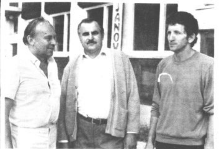
Naši sogovorniki v krajevni skupnosti Bevče

V Bevčah so torej zadnja leta veliko naredili, veliko dela pa jih čaka tudi v prihodnje in kot so povedali naši sogovorniki, potrudili se bodo, da bodo delovne zmage beležili tudi v prihodnje. mz, sv