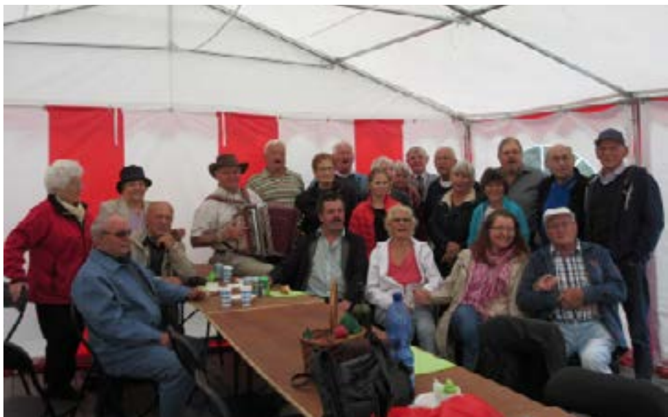
Skupna slika vseh zbranih na sečanju vseh generacij v Barnakälli pri Bromölli