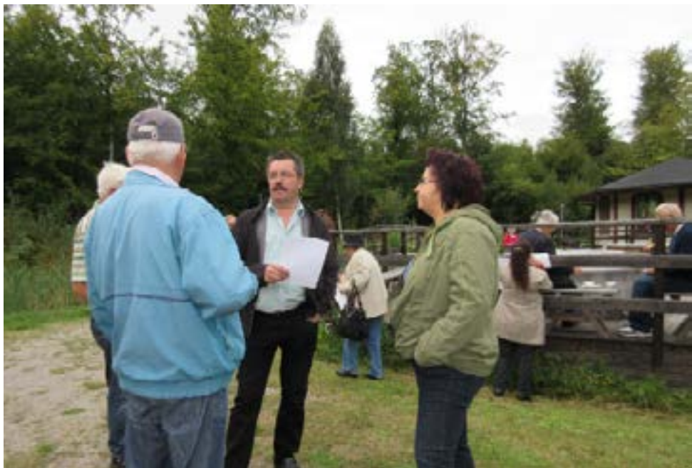
Pomemben pogovor na samem srečanju.