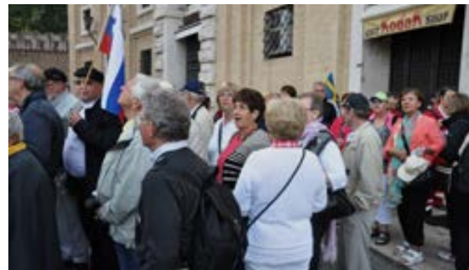
št. 3, slike si sledijo po vrsti