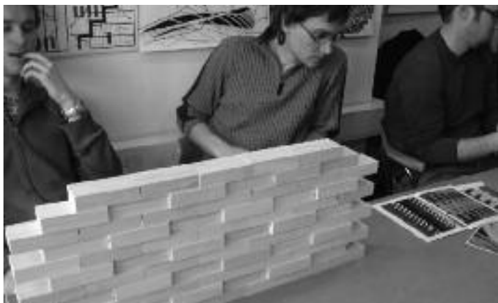
Vaje z modelno opeko na temo Ravnikarjevega Ferantovega vrta pri predmetu Moderna slovenska arhitektura v šolskem letu I. 2008 na Fakulteti za arhitekturo v Ljubljani.