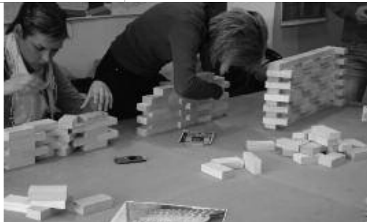
Vaje z modelno opeko na temo Ravnikarjevega Ferantovega vrta pri predmetu Moderna slovenska arhitektura v šolskem letu I. 2008 na Fakulteti za arhitekturo v Ljubljani.

Podatki o vpisih v mednarodni register moderne arhitekture Docomomo International, so dostopni na www.docomomo-registers.com . V letošnjem letu praznuje organizacija Docomomo International 20. obletnico svojega obstoja. Vsaki dve leti se odvije mednarodna konferenca na določeno temo. Tema letošnje konference je »The Challenge of Change« in bo sredi septembra v Rotterdamu na Nizozemskem, kjer bo slavnostni govornik arhitekt Herman Hertzberger. Več podatkov o organizaciji Docomomo in konferenci dobite na www.docomomo.com