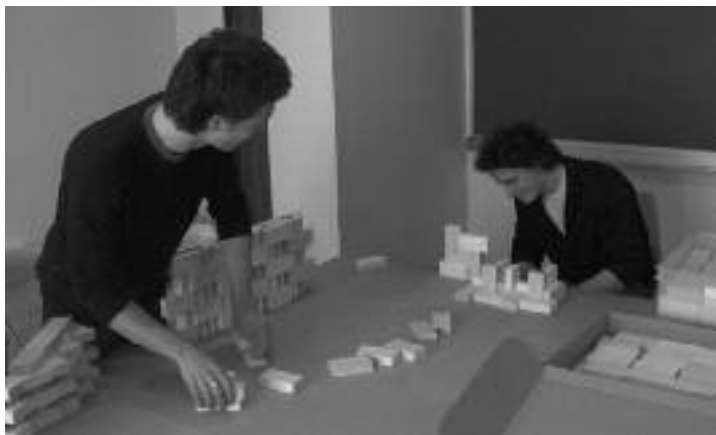
Vaje z modelno opeko na temo Ravnikarjevega Ferantovega vrta pri predmetu Moderna slovenska arhitektura v l. 2007 na Fakulteti za arhitekturo v Ljubljani.