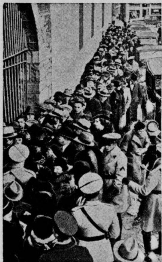
Takole se drenjajo pred sodiščem v Flemingtonu, da bi prišli na vrsto. Niti silni mraz jih ne prežene. Več žensk je celo od mraza omedlelo. Pa radovednost je hujša ko zima.

Redki so prijatelji v nadlogi. Resnični prijatelji so redko sejant.