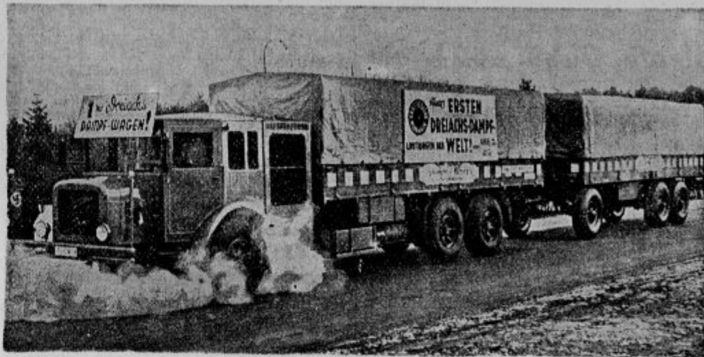
Avtomobili na paro so izdelali v Kasselu na Nemškem. Kurijo ga s katranovim oljem, katero pridobivajo iz rjavega premoga.

Čeprav si znanost solnčnih peg ne zna še razložiti, vendar vedo o njih toliko, da povzročajo velike elektrotehnične učinke, kateri vplivajo tudi na življenje na zemlji.