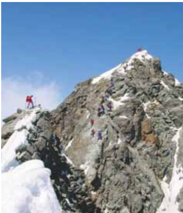
Vršni del Grossglocknerja