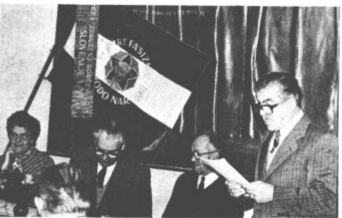
Odkrito so spregovorili o težavah