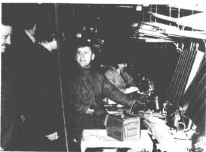
Skupina Vegradovih delavcev se je dobro vključila v delovni proces v Gorenju.

Takšno obliko pomoči, kot jo je izbral Vegrad, so v Gorenju z navdušenjem pozdravili. Delavci Vegrada bodo prejeli za delovne dni, ki so jih opravili v Gorenju, osebni dohodek v matični delovni organizaciji. V Vegradu pa bodo kasneje, v višku gradbene sezone organizirali solidarnostni delovni dan za vse zaposlene.