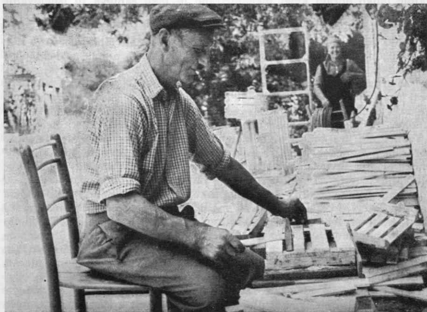
Kmet Sever iz Malih Lipljen zbija gajbe

Spremembe v domači obrti Škocjanskih hribov kažejo, da so bili tod ljudje pri obdelovanju lesa vedno spretni in domiselni in da so tudi svojo hišno dejavnost in domače obrti prilagajali življenjskim potrebam, dejanskemu stanju, zahtevam na trgu, in v zadnjih letih jih prilagajajo tudi vsem spremembam, ki jih prinaša današnji čas. Tako je domačo obrt izdelovanja zobotrebcev in gajbic pri posameznih kmetih nadomestilo celo izdelovanje lesenih gradbenih elementov za weekend hiše. S tem pa se