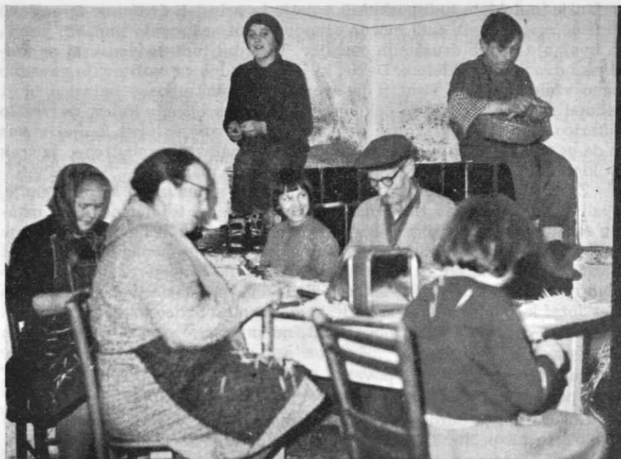
Večer pri kmetu Baldku v Malih Lipljenih. Domači in sosede izdelujejo skupaj zobotrebce. (Fot. pozimi 1965)

(za olje in pozneje za petrolej). Važnejše kot to pa je bila potreba po družabnem življenju. To je bilo že od nekdaj v teh krajih močno razvito. Razvite so bile najrazličnejše oblike medsebojnih odnosov. Močno je bila razvita tudi fantovščina. Tu je bila že poprej navada, da so se vaščani redno, ob zimskih večerih zbirali na preji. O tem zgovorno pripoveduje zapis: