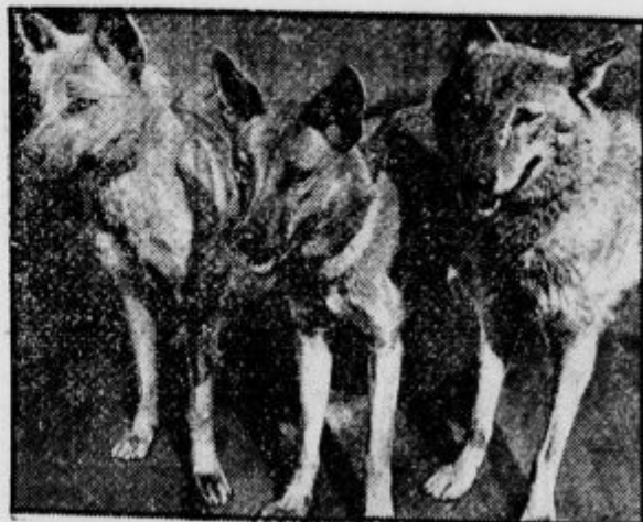
Psi — ovčjaki