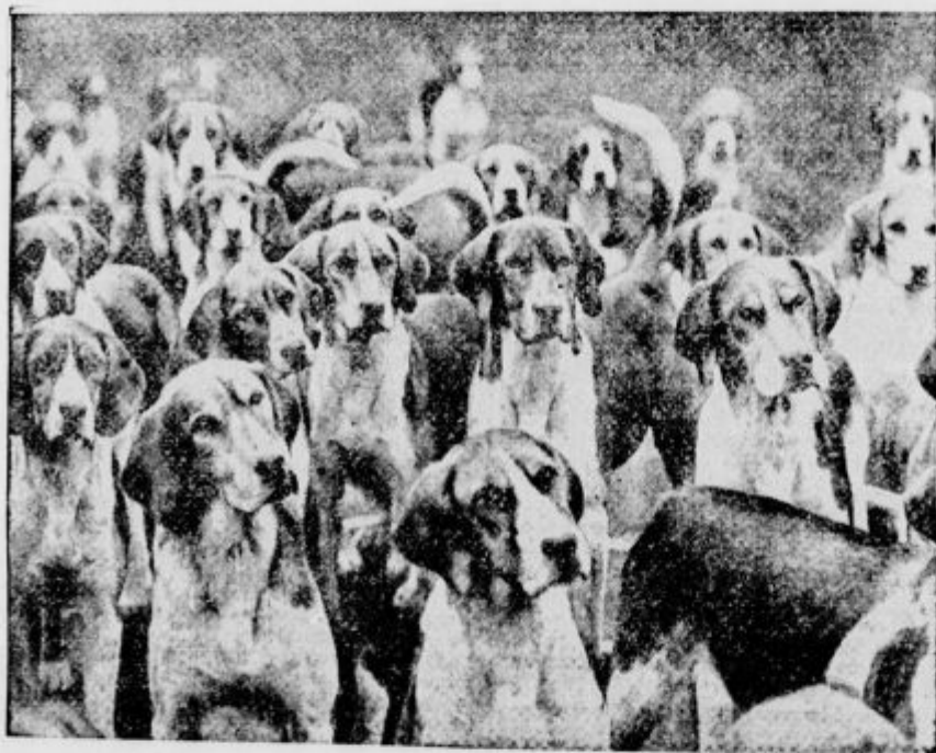
Skupina lovskih psov