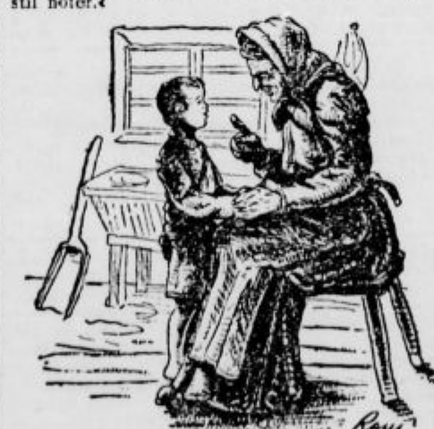
»Sam od sebe ne more nihče v nebesa.«

»Potem ne ostanem nič več tukaj. K mamiči grem v nebesa. Nebeški Oče me bo že pustil noter.«