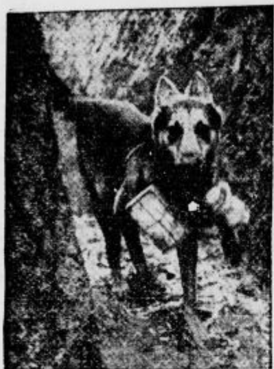
Pes - pismonoša na bojišču