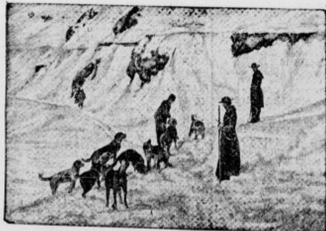
Bernardinci rešujejo popotnike izpod snega

Pes je umna žival in se marsičesa priučil, o čemer smo se mnogi že prepričali pri pasjih nastopih v raznih cirkusih.