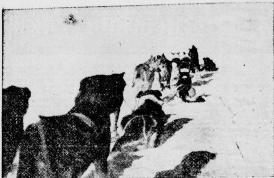
Pasja uprega na severnem tečaju