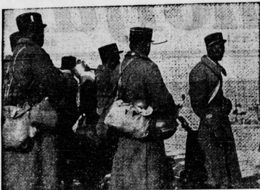
V neko italijansko pristanišče so prispeli francoski ujetniki, zajeti v bojih v Tunisu