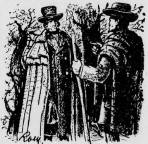
Kdo in kaj pa ste vi?

»Za božjo voljo,« je bruhnilo iz mene, »vsa v eni reči, prosim, umirite mojo radovednost! V imenu vsega, kar je skrivnostnega, kdo in kaj ste vi?«