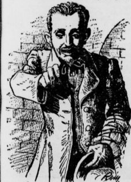
»Vi strahopetni pes.«