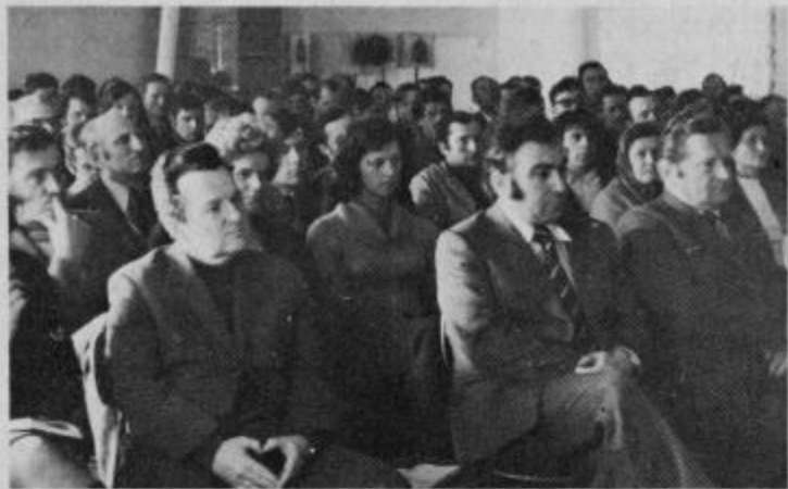
Z zbora opekarjev v Žabjaku