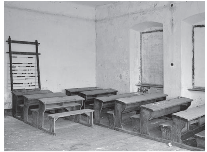
Slika 4: Učilnica z ohranjeno šolsko opremo v nadstropju. Foto: Anja Premk, Preloka, oktober 2012.