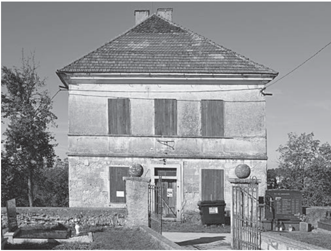
Slika 3: Glavna fasada šole. Foto: Janez Premk, Preloka, oktober 2012.