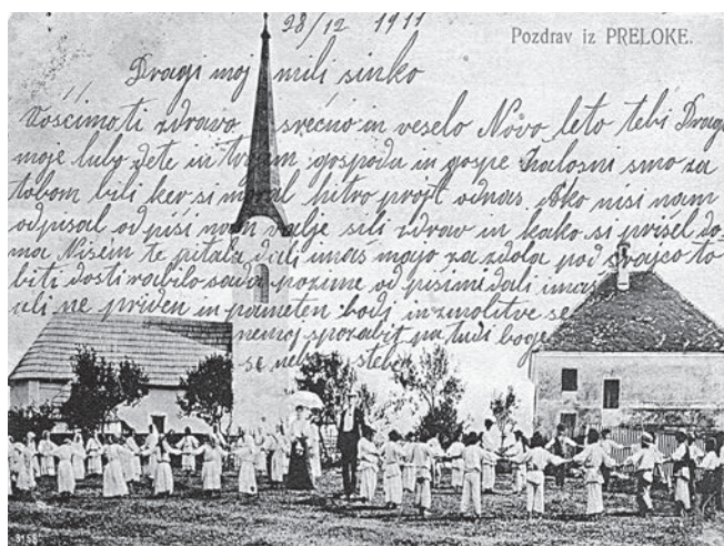
Slika 1: Cerkev in šola, pred njo pa ples učencev in učenek z učiteljskim parom v sredini.

Foto: Preloka, okoli 1906 (zasebni arhiv Ane Starešinič).