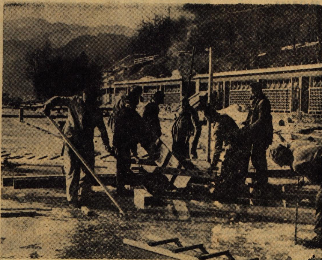
Ceprav je Blejsko jezero pokrito z debelo plastjo ledu, so delavci blejskega Komunalnega podjetja že začeli s pripravami na novo turistično sezono. Najprej bodo zgradili plavalni bazen olimpijskih dimenzij, podirati pa so začeli tudi stari skalalni stolp na blejskem kopališču. Pravilo, da bo nov stolp, skupaj s plavalnim bazenom nared do začetka nove turistične sezone. Fotoreporter je utjel delavce, ko nekaj metrov dolge kole zabljajo skozi led v jezersko dno. Ves bazen bo betoniran.

● Bled — Na osnovni šoli je zaključilo prvo polletje 887 učenec, od teh 74,63 odstotka s pozitivnim uspehom. Najslabši je uspeh v angleščini, matematiki in slovenščini. J. B.