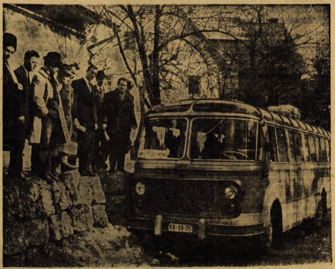
Gorenjska cesta je na nekaterih odsekih nemogoča. To nam potrjuje tudi posnetek. Povrh vsega se najdejo še neobzirni vozniki motornih vozil, ki dobesedno divjajo, čeprav cesta tega ne dopušča. V ponedeljek bi kmalu prišlo do prometne nesreče na ozkem cestišču v Podbrezjah. Le spreten voznik avtobusa jo je preprečil s tem, da je zapeljal tik ob škarpini z desno stranjo avtobusa tudi podrsal. Potniki niso mogli drugače iz avtobusa, kot skozi okno pri zadnjih vratih. — Škoda je nezamena

Komisija, ki je prišla na kraj dogodka, je ugotovila, da je do požara, ki je terjal več kot za štiri milijone dinarjev škode, prišlo zaradi Šolarjeve malomarnosti in nepazljivosti.