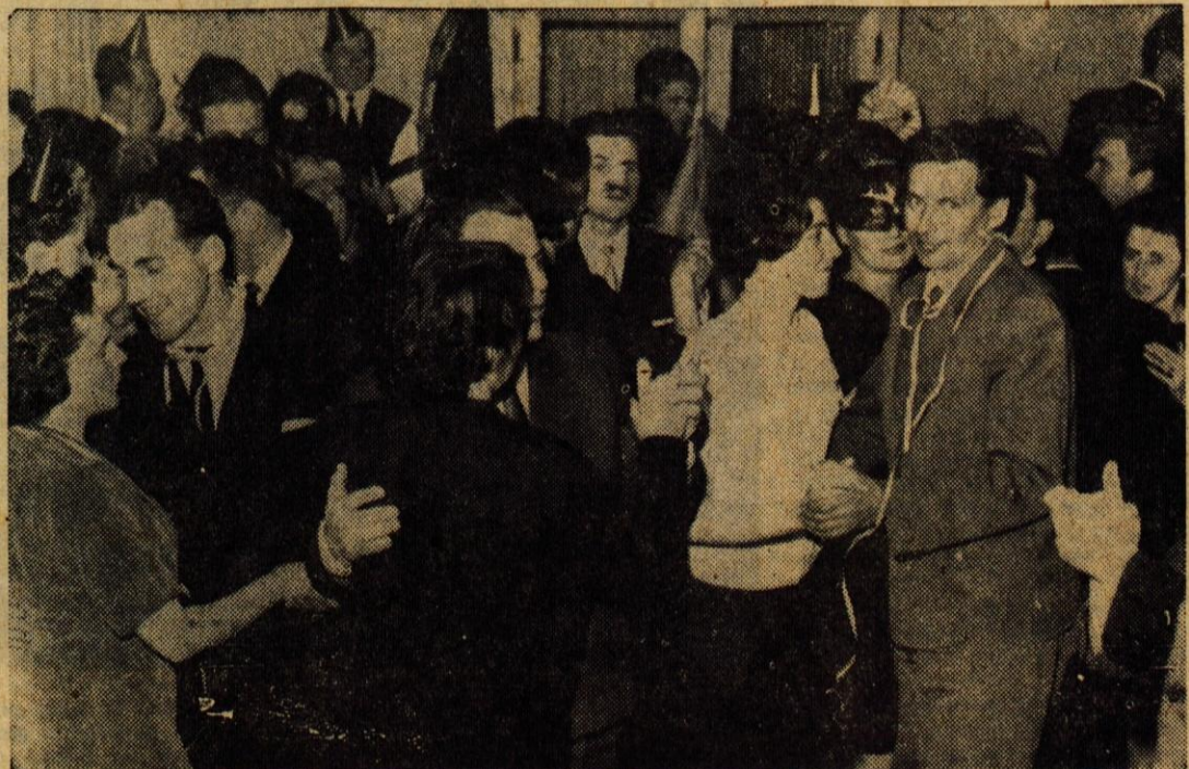
Pustne zabave dokazujejo, da se ljudem priležajo opravilne priložnosti za veseljačenje

Vezenemu blagu za ženske bluze (na lahki pralni tkanini) in vezenemu blagu za ženske večerne obleke (na volneni tkanini), ki sta si lansko leto zelo hitro osvojila tržišče, se bo letos pridružilo še vezanje na jersey blagu. Ta izdelek bodo pripravili v sodelovanju s tovarno Almiro. Prav v teh dneh pričakujejo še en vezilni stroj, saj z dosedanjimi stroji tolikšnih načrtov in naročil ne bi mogli.