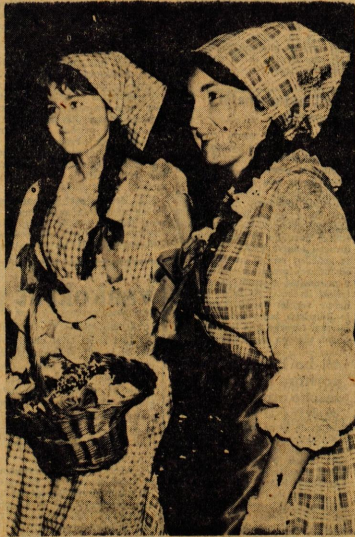
Ko sta dekleti odkrili svoj maski, smo se lahko prepričali, da se pod krinkami skriva marsikaj simpatičnega

Tudi na drugih področjih so zelo aktivni. Aktiv ZMS predvaja ob sobotah in nedeljah ozkočrtno ob filme. Imajo pa tudi televizijo.