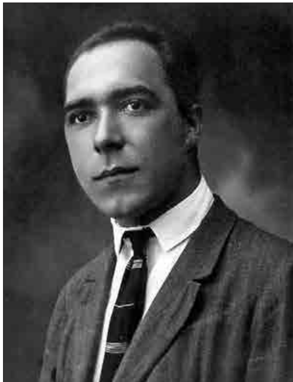
Dr. Janko Kralj.

Krščanskosocialno gibanje, ki se je leta 1922