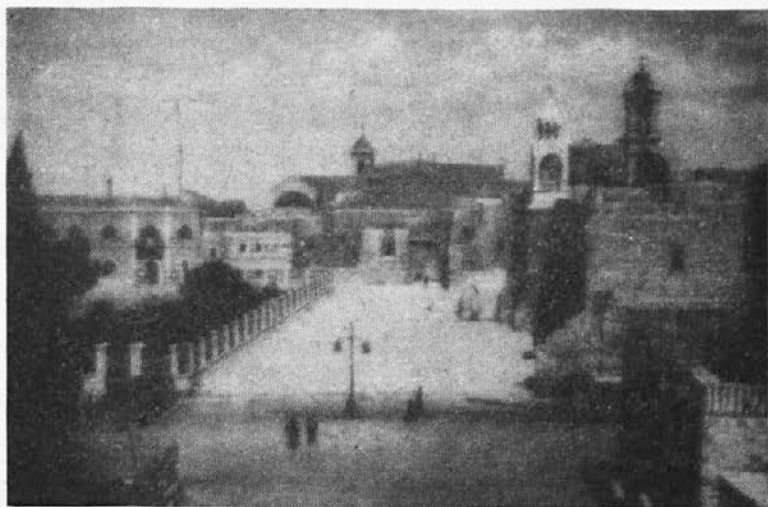
Betlehem: Trg pred cerkvijo Rojstva

"Spoznajte vsi, kako je prišel na svet Kristus, ki še vedno živi v svoji Cerkvi. Prav tako se še vedno razodeva svetu od tu, iz te zibel, s tega mesta, kjer se je nekoč rodil."