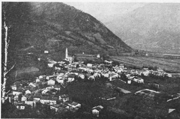
Vas Volče pri Tolminu