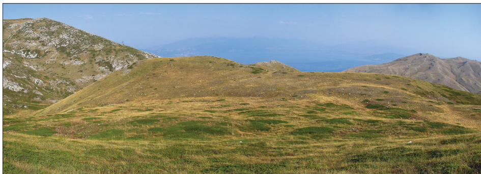
Figure 2: About 350 m long lateral moraine on the northern rim of Pleistocene ice cap delimiting the area of ground moraines in the foreground

Led se je iz osrednjega ledenega pokrova stekal v dveh ločenih odtočnih ledenikih v smeri severa proti prevalu Ponce. Zahodni ledenik je poleg ledu iz ledenega pokrova dobival led tudi iz dveh krnic na zahodnem pobočju doline. Večja in višja krnica je na višini 2050 m, nižja pa na 1900 m. V vrhnjem delu doline zahodnega odtočnega ledenika med obema krnicama se na nasprotnem pobočju nahaja izrazita ledeniška rama, na podlagi katere lahko ugotovimo, da je bila debelina odtočnega ledenika v tem delu okoli 80 m. Vzhodni odtočni ledenik je v zgornjem delu doline nasul izrazite bočne morene, ki kažejo, da je bila debelina tega ledenika okoli 70 m. Na pobočju južno od prevala Ponce so ohranjene izrazite bočne morene, ki označujejo največji obseg obeh odtočnih ledenikov ob višku zadnje poledenitve. Zahodni odtočni ledenik se je zaključil na nadmorski višini 1530 m, vzhodni pa na 1560 m. Po osrednjem delu dolin obeh odtočnih ledenikov potekata erozijska jarka, ki sta v času poledenitve odvajala podledeniške in predledeniške vodotoke. Potoki, ki so odtekali proti Ohridskemu in Prespanskemu jezeru, so v spodnjih delih pobočij nasuli rečno-ledeniške vršaje.