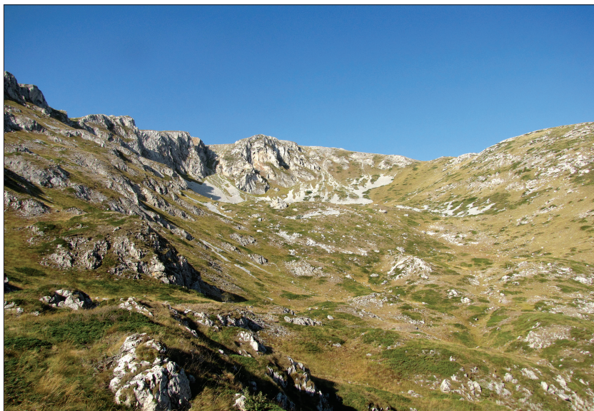
Slika 6: Erozijski jarek v zgornjem delu doline vzhodnega odtočnega ledenika