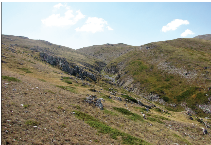
Figure 6: A gully in the upper part of the valley filled with the eastern outlet glacier during the Last Glacial Maximum