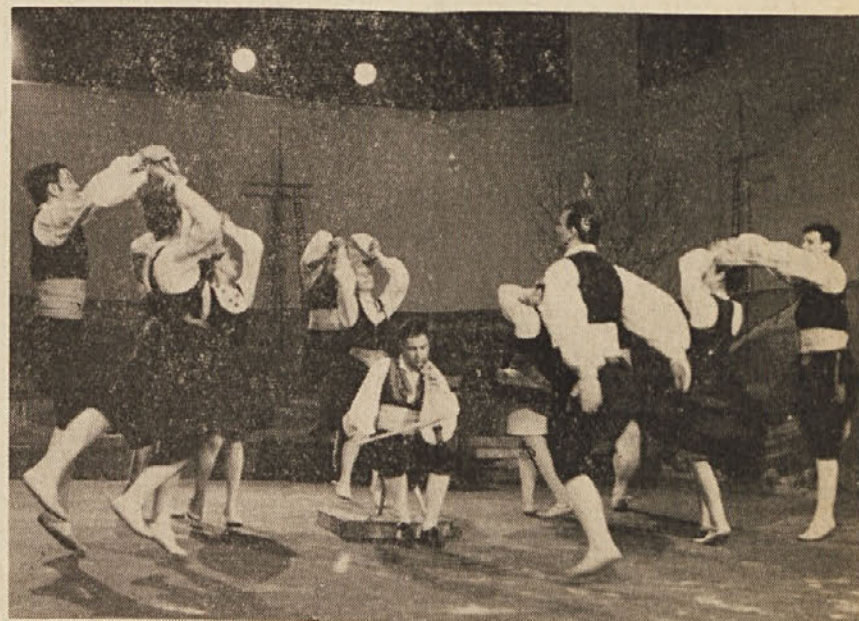
Folklorna skupina Kulturno umetniškega društva JOŽA VLAHOVIČ iz Zagreba. Na sliki: ples »Dubrovačka poskočica«.