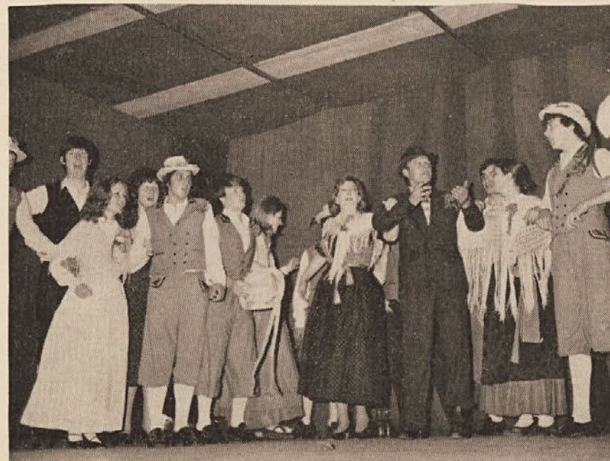
Dramska skupina iz Boljunca