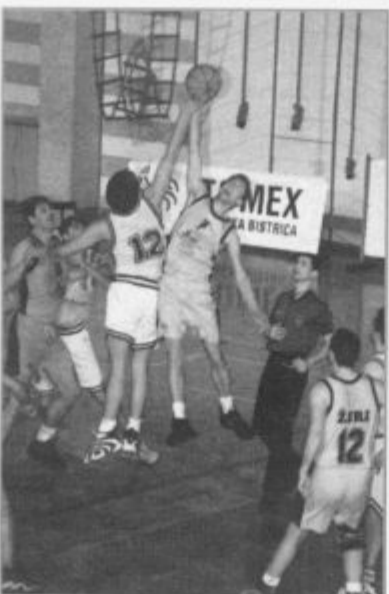
Gostje iz Žirov so naredili manj napak

štiri minute do konca tekme. Takrat so namreč gostje zadeli trojko in drugič povedli. Nato je šlo pri domačih samo navzdol, saj