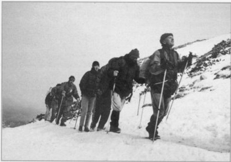
Ko je veter razgнал meglo, se je pokazalo tudi sonce.