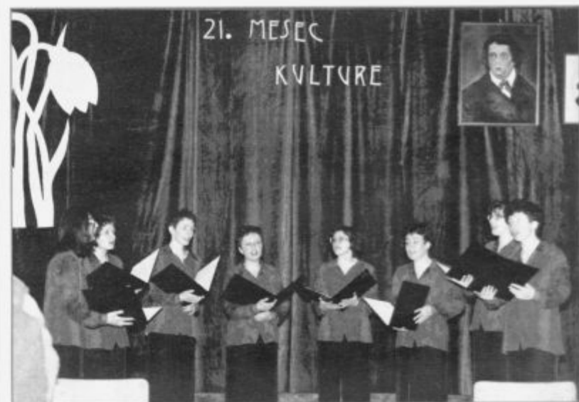
Pevska skupina Flora iz Begunj pri Cerknici

Po nežnem, zmerno igrivem, pa spet šaljivo razigranem petju Begunjk so nastopili moške in fantje iz Slavine. Suveren nastop, kompaktnost, energija in izrazita dinamika so vrline, ki jih nikakor ne bi pripisali pevski skupini iz majhnega in dokaj neznanega kraja. Zbor vodi dirigent, ki je član slovitega »Sončka«. Uspelo in prijetno srečanje se