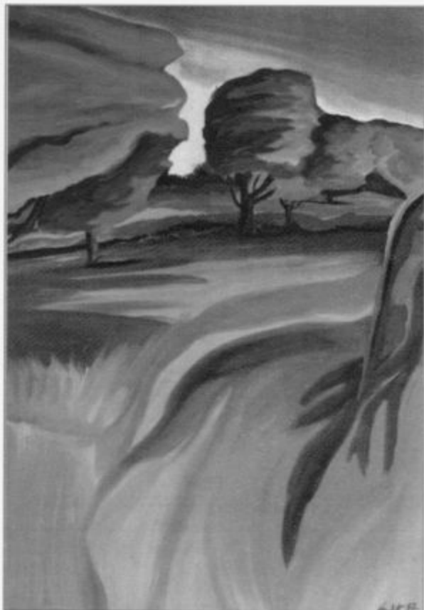
BREZ NASLOVA, akril na platnu, 70 x 100 cm, 1997