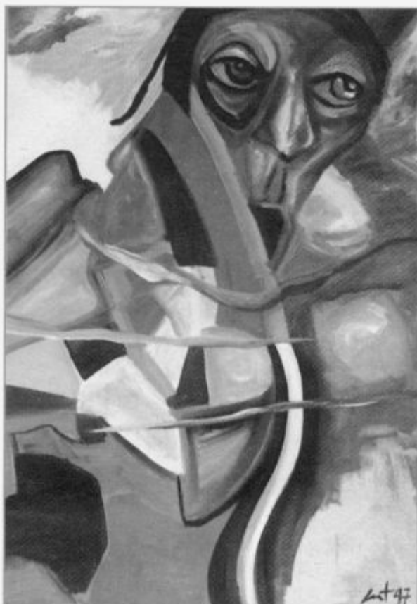
TAKO VELIKO GOVORI, akril na platnu, 70 x 100 cm, 1997