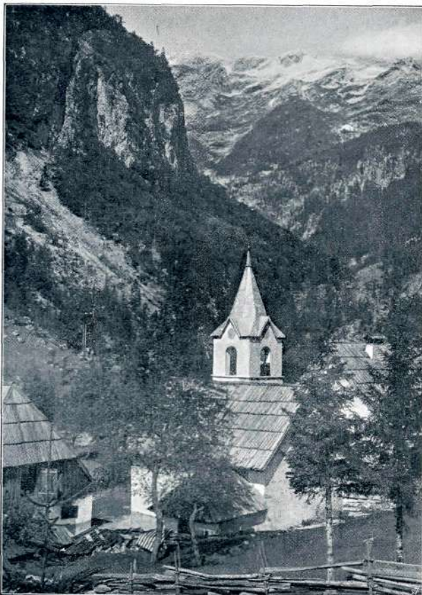
SV. MARIJA V TRENTI

Pa še ni srede skalnate pečine. Spet iščejo oči novih oprijemkov. Znojne kaplje rosé belo čelo.