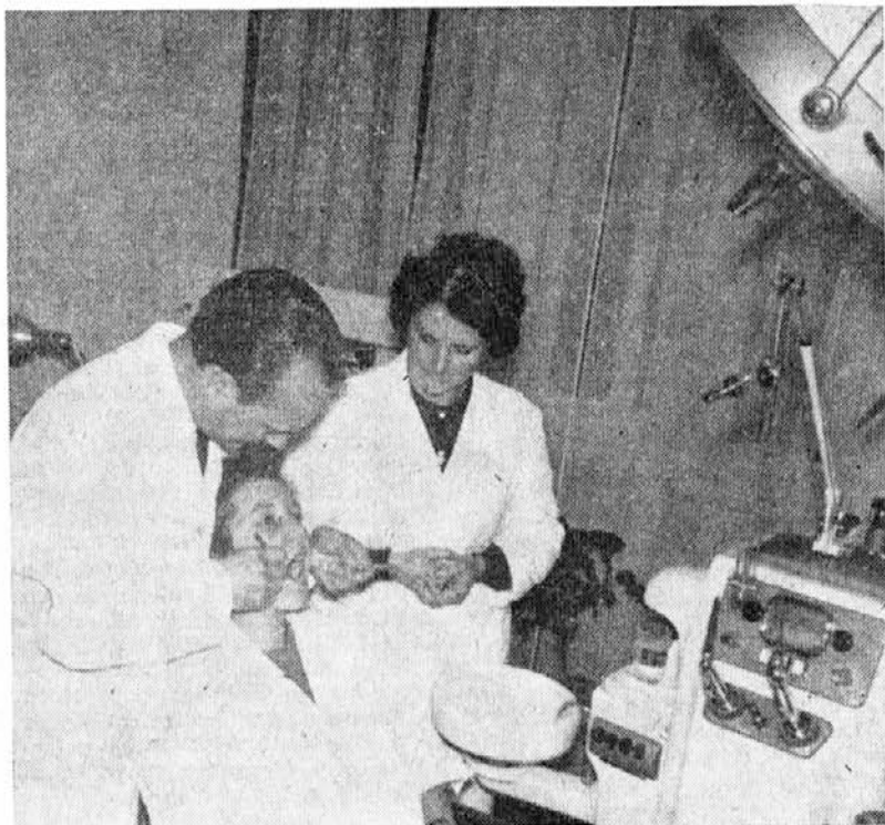
Motiv iz naše zobne ambulante