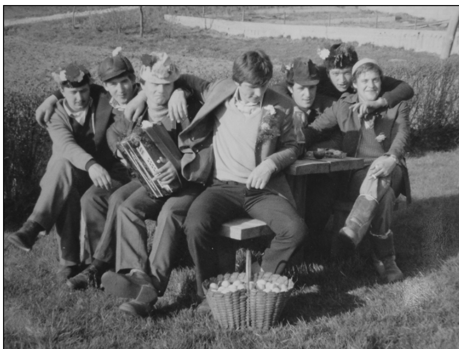
Utrinek s florjanjevanja v Zavodnjah v osemdesetih letih 20. stoletja.

samo tri jajca. 26 Danes je poleg njih na mizi vse pogosteje tudi denar: »Damo kako jajco pa kakega jurja.« 27