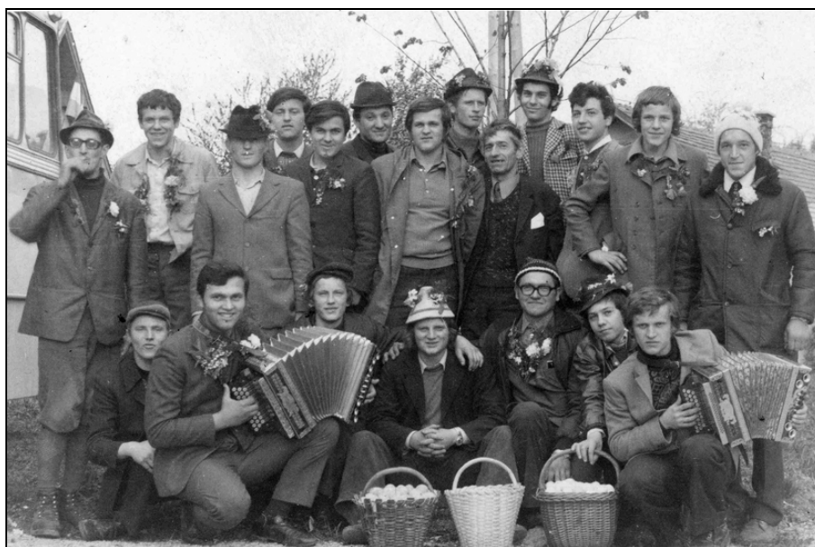
Druščina florjanovih kolednikov v Zavodnjah v sedemdesetih letih 20. stoletja z jajci, ki so jih zbrali na obhodu po vasi.