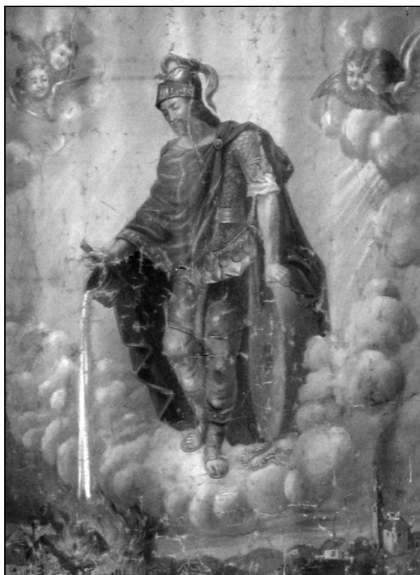
Sv. Florijan na banderu cerkve sv. Florijana v Florjanu. Svetnik gasi kmetijo, ki jo je zajel požar. Spodaj desno sta upodobljeni florjanski cerkev in kapela.

Četrtega maja goduje sv. Florijan, priprošnjik pred povodnjo, požari, sušo, vojsko in za rodovitnost polj. Poleg pregovorov, rekov, šeg, navad ter vsakoletnih dogodkov in prireditvev, povezanih s florjanovim, o svetnikovi priljubljenosti še danes pričajo številne starodavne in sodobne upodobitve, najpogosteje na pročeljih stavb: svetnik v opravi rimskega vojaka iz golide zliva vodo na gorečo hišo pod seboj. Njegov atribut je mlinski kamen kot spomin na mučenje in smrt v reki Anizi v Gornji Avstriji. 1