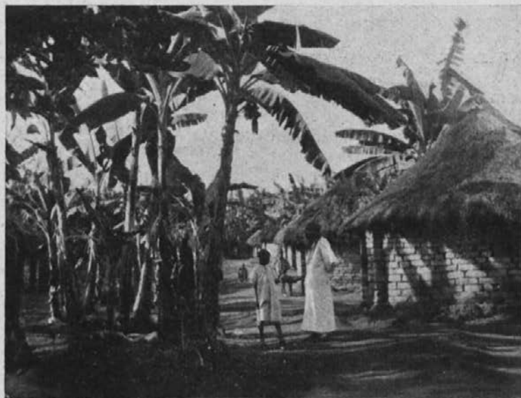
Koče zamorcev v Ugandi. Misijonar v pogovoru z malim zamorčkom.