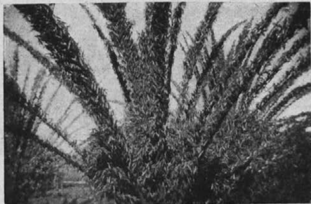
Palma, popolnoma obsedena od kobilic.

Danes so se zopet zbrali ljudje in šli na vojsko zoper kobilice. Najprej so šli na železniško postajo po strupe, potem so se podali na delo. Strupe brizgajo po tleh, časih jih pomešajo tudi med oslovsko blato in blato raztresejo. Kopljejo jarke in jih napolnijo z roji kobilic in potem zasujejo. Zakurijo velik ogenj in mečejo mrčes v ogenj.