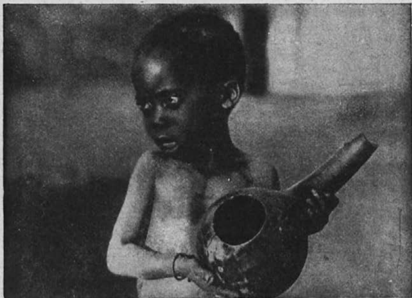
Siromak nima več hrane, lonec je prazen.