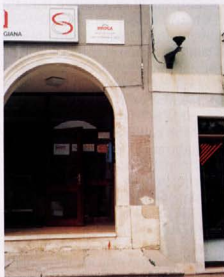
DROGA Hrvatska je uspešna firma. Za tablo, ki nas opozori nase, tega ne bi mogli reči.

novi državi Hrvatski. DROGA Hrvatska je bila registrirana 17.12.1991. Z registracijo pa se še ni začelo pravo delovanje podjetja, premaknilo se je šele v prvem tromesečju 1992.