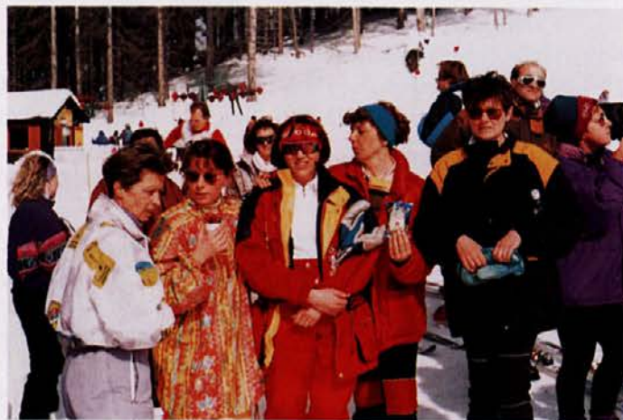
Na sliki so naše tekmovalke v pričakovanju rezultatov tekmovanja v ženskem veleslalomu