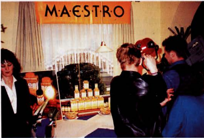
O podelitvi nagrad je prispevek posnela tudi TV Maribor

V marketingu smo se v zadnjih letih poleg klasičnega tržnega komuniciranja (TV spoti, radio spoti, oglasi...) lotili tudi t.i. nagradnih iger. Prva je bila "Kave, kolikor tehtate" v Slovenskih novicah leta 1993. Odziv je bil izjemen, saj je prišlo več kot 100.000 kuponov. Jeseni 1994 smo nadaljevali z akcijo "Slovenska kava", tudi v Slovenskih novicah. V letu 1995 so prišli na vrsto tudi ostali programi: Začinka, mlevski izdelki in riž Zlato polje.