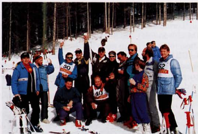
Tekmovanje je mimo, rezultatov še ni, zato vsak zase misli, da je progo najhitreje zvozil