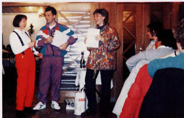
LILI - drugo mesto, pivček!