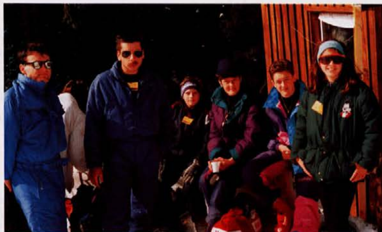
Predstavniki ARGA so udeležence izleta razveselili tudi zato, ker ljudje ne bodo mogli govoriti... ja, ja, samo tisti iz skupnih služb so šli ... kot po navadi. BRAVO ARGO, vidimo se tudi na naslednjem smučarskem izletu!