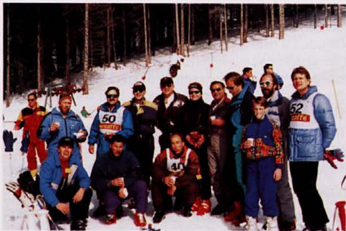
Zbiranje različnih bioloških moči pred tekmo

V nadaljevanju si v sliki in besedi oglejte veleslalom Droge Portorož