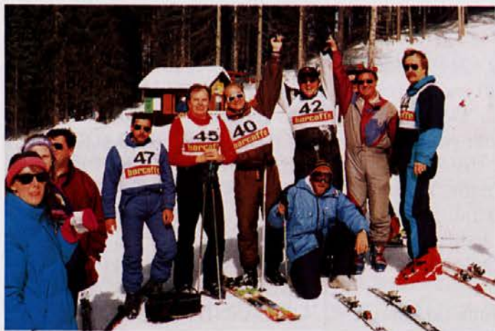
Neuradni rezultati so že znani, veselje je upravičeno, vendar... le trije so lahko: PRVI, DRUGI, TRETJI