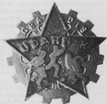
Udarniški znak Gradisa

Čeprav smo zapisali, da bi bilo lepo, če bi o udarniškem znaku iz Ajdovščine imeli še več podatkov, o naslednjih dveh slovenskih udarniških znakih ne moremo zapisati niti toliko. Prihajata iz dveh podjetij, toda proizvodnja v enem in drugem kolektivu so ostala brez odmeva.