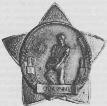
Udarniški znak, podeljen v Ajdovščini 1946

Udarniško gibanje je zmanjševalo potrebo po novi delovni sili ter nadomeščalo manjkajočo. V Sloveniji je bilo v letih 1946 do 1949 razglašenih 38.397 udarnikov. Po posameznih letih pa je bila slika taka: leta 1946 razglašenih 1444 udarnikov, 1947 — 6 972 udarnikov, 1948 — 10 761 udarnikov in leta 1949 — 19 220 udarnikov. 12 Po spremembi potrebnega časa za doseg udarništva je leta 1950 število razglasitev skokovito zraslo. Leta 1950 so bili med udarniki številčno najmočnejše zastopani delavci v industrijskih obratih in rudnikih — 46 odstotkov udarniških naslovov, 24 odstotkov naslovov so imeli delavci gradbene stroke, tem so sledili prometni, kmetijski in drugi delavci. 13 V Mariboru je leta 1950 dobil skoraj vsak šesti delavec ta naziv. Ob teh, v tisku objavljenih podatkih, je zanimivo pogledati v organizacijsko poročilo CK KPS za II. kongres Komunistične partije Slovenije, ki je bil novembra 1948 v Ljubljani. 14 Po tem poročilu, ki se lahko nanaša le na stanje do druge polovice leta, je bilo v Sloveniji okrog 3000 udarnikov, vendar med njimi samo 445 članov Partije. V poročilu za III. kongres Ljudske mladine Slovenije, ki je bil junija 1947, je bilo med 5214 udarniki, ki so bili razglašeni v Sloveniji, 519 mladincev in mladink. 15