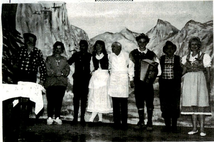
Igralska družina Merrylands uprizarja v Verskem in kulturnem središču Merrylands v Sydneyu v soboto, 23. aprila 94 premiero Divji lovec , več na str.8