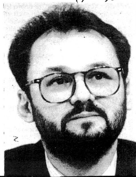
Desno: novi obrambni minister RS Jelko Kacin