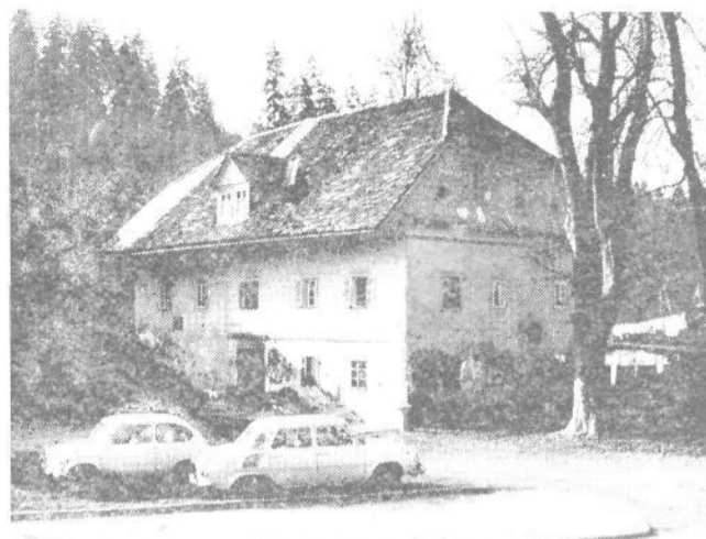
Pogled na rojstno hišo našega pesnika Valentina Vodnika. Več o načrtih za ureditev hiše v naslednji številki

Na 5 strani zadnje številke našega lista nismo obsodili naših gimnazijcev, temveč smo obratno le osvetlili njihov neprijetni položaj, ker imajo skupni dramski abonma z obrestneži iz nekaterih drugih šol izven naše občine.