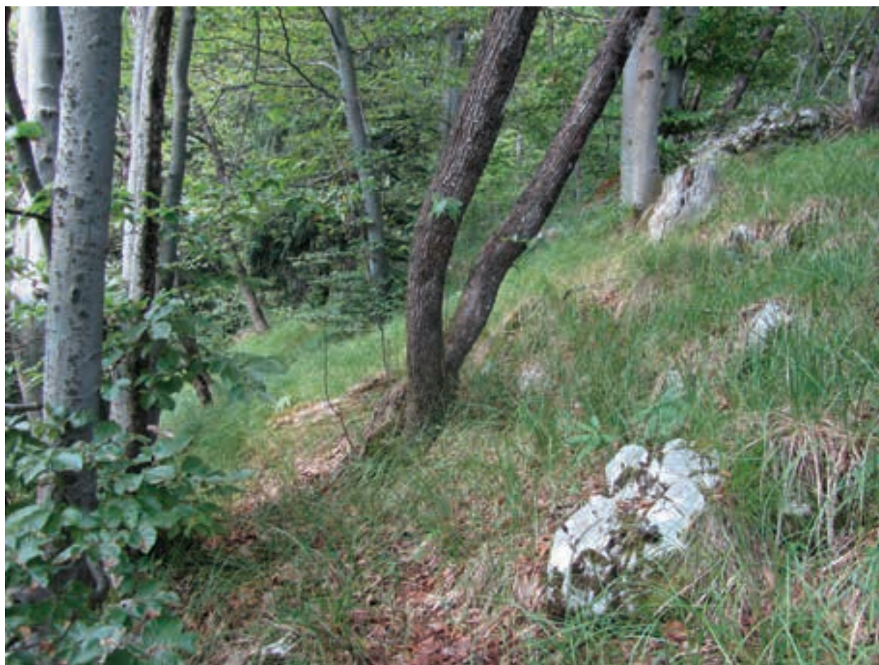
Figure 4: Seslerio autumnnalis-Fagetum on the western slope (September 8, 2013) Slika 4: Seslerio autumnnalis-Fagetum na zahodnem pobočju (8. september 2013)

most as abundant in the herb layer as autumn moor grass; as well as the species that are common in beech stands, the species Anthericum ramosum , Genista januensis , Silene nutans , Teucrium chamaedrys , on one relevé also Piptatherum virescens , also have high abundance in these stands. Silene hayekiana and Festuca stenantha were recorded in rocks. The full species composition undoubtedly indicates potential beech community from the association Seslerio autumnnalis-Fagetum . The real vegetation is a degradation stage classified into the syntaxon Seslerio autumnnalis-Ostryetum carpinifoliae (Figure 5). The fifth relevé above Bezovnjak differs from the other three relevés whose tree layer is dominated by hop hornbeam mostly by the absence of autumn moor grass. The herb layer is dominated by white sedge ( Carex alba ); other species occurring with a slightly higher proportion are thermophilous species from classes Rhamno-Prunetea , Trifolio-Geranietea and Festuco-Brometea , such as Melica ciliata and Gali-