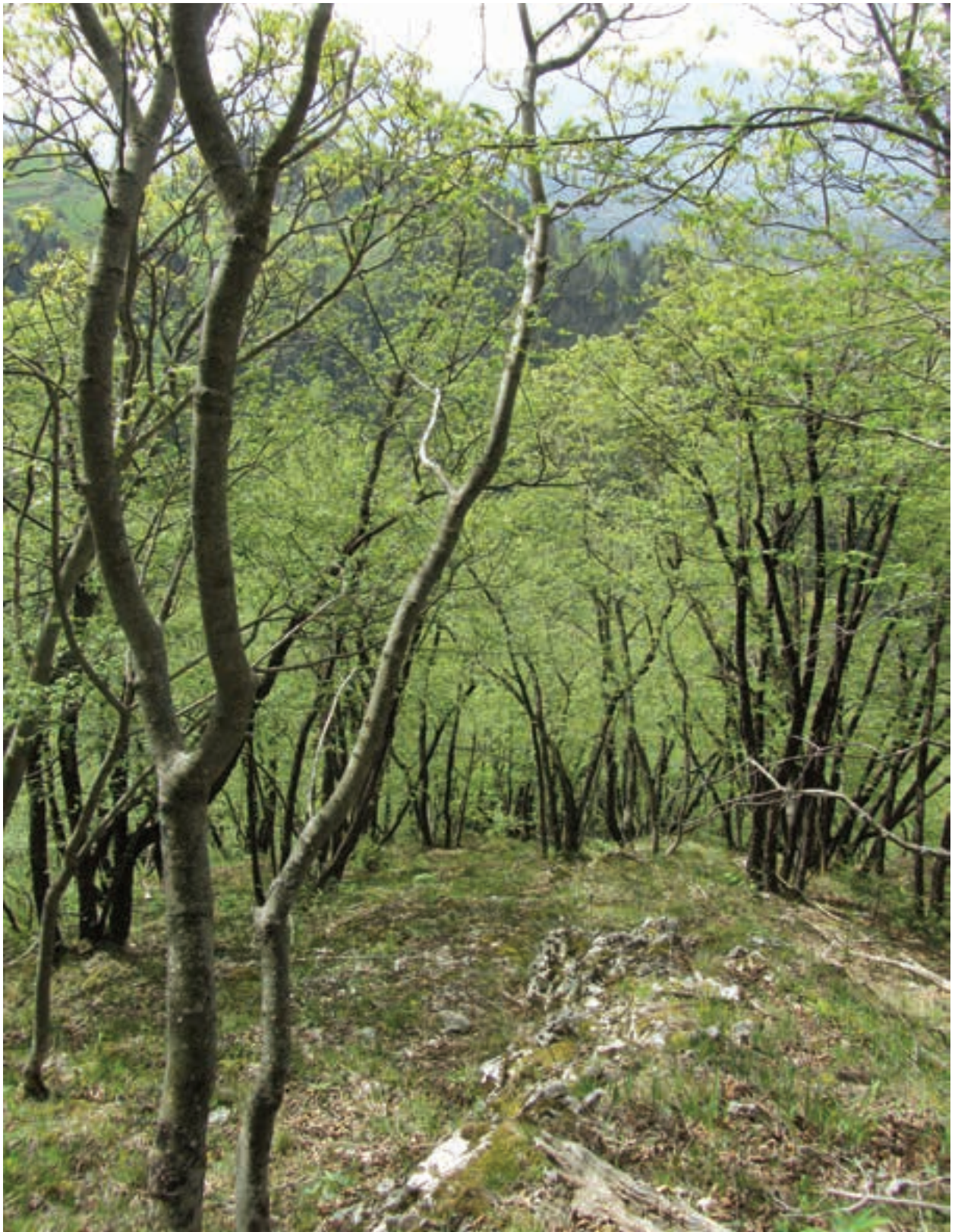
Figure 6: Fraxino orni-Ostryetum carpinifoliae on the southern ridge (May 1, 2013) Slika 6: Fraxino orni-Ostryetum carpinifoliae na južnem grebenu (1. maj 2013)