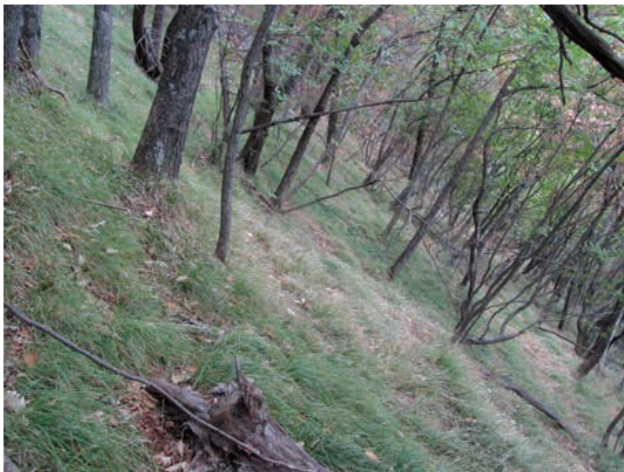
Figure 5: Seslerio autumnalis-Ostryetum carpinifoliae on the eastern slope (September 8, 2013) Slika 5: Seslerio autumnalis-Ostryetum carpinifoliae na vzhodnem pobočju ((8. september 2013)

Savinja Alps is situated far from the so far known distribution areas of this community; it is a distinctly disjunct and the northeasternmost locality in the entire distribution area of the association Seslerio autumnalis-Fagetum . Its surface area is far from negligible; according to our estimates the total forest area on calcareous bedrock consists of around 10 ha and the area of the stands of the association Seslerio-Fagetum comprises at least 5 ha and can be shown also on small-