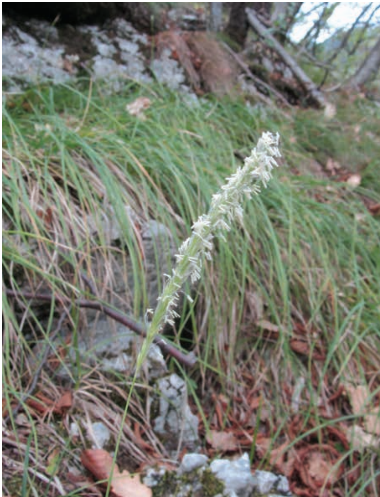
Figure 2: Sesleria autumnalis , Juvanje near Ljubno ob Savinji (September 8, 2013) Slika 2: Sesleria autumnalis , Juvanje pri Ljubnem ob Savinji (8. September 2013)