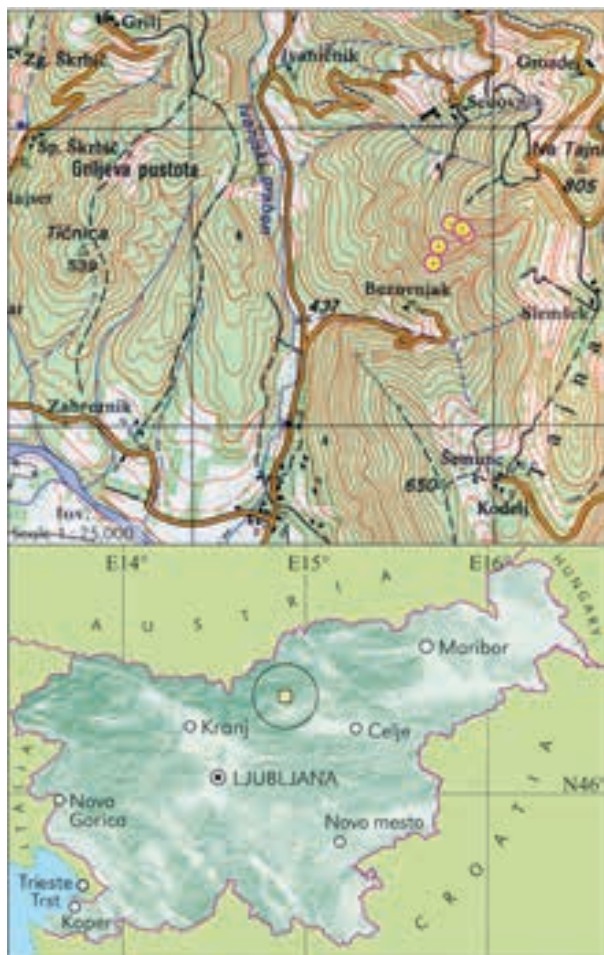
Figure 7: The extent of stands of associations Sesleria autumnalis-Fagetum and Sesleria autumnalis-Ostryetum above Bezovnjak with points marking the relevés Slika 7: Obseg sestojev asociacij Sesleria autumnalis-Fagetum in Sesleria autumnalis-Ostryetum nad Bezovnjakom s točkami fitocenoloških popisov

Ljubno z okolico sodi v Zgornjo Savinjsko dolino, fitogeografsko pa v alpsko območje (M. WRABER 1969).