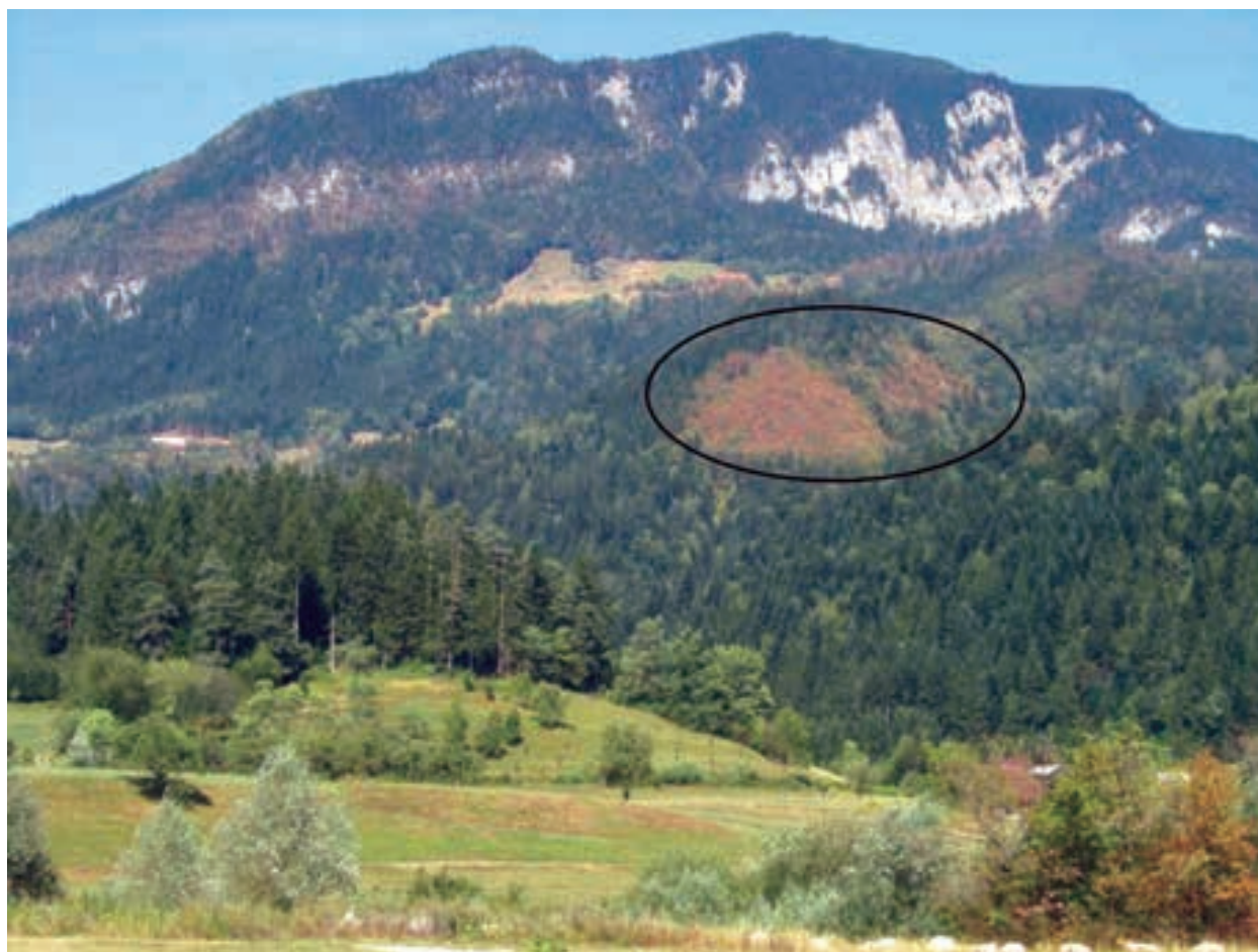
Figure 3: View to the stands with Sesleria autumnalis (marked with ellipse) under Tirske peči (August 19, 2013) Slika 3: Pogled na sestoje z vrsto Sesleria autumnalis (označeno z elipso) pod Tirskimi pečmi (19. avgust 2013)

Ljubno and its vicinity are part of the Upper Savinja Valley, but in terms of phytogeography they belong to the Alpine region (M. WRABER 1969). ZUPANČIČ et al. (1989) classify this part of the Savinja Valley into the district of Štajerska-Koroška, the pre-Alpine subsector of the Southeastern Alpine sector of the Illyrian floral province. Although igneous rocks prevail in the vicinity of Ljubno (MIOČ & ŽNIDARČIČ 1983, BUSER 2009), the geological bedrock of the study area consists of do-