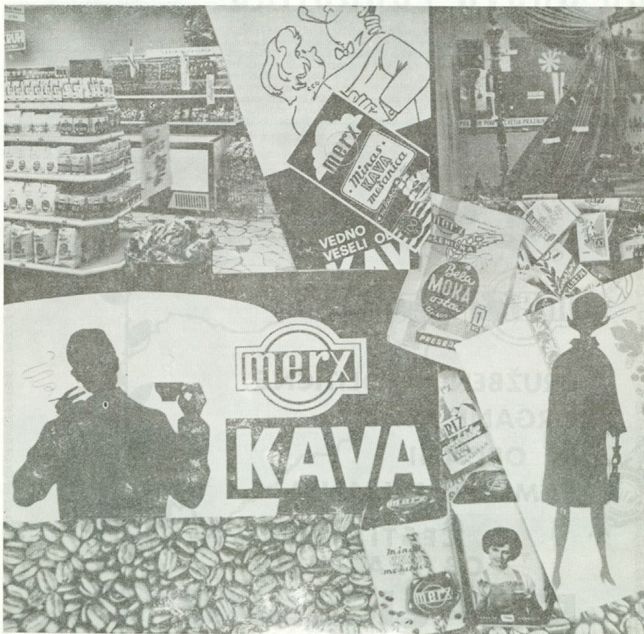
Mozaik del naše propagande

Služba ekonomske propagande je v stalnem kontaktu z nabavno in prodajno službo grosističnega sektorja z vsemi proizvodnimi obrati, maloprodajno mrežo ter enotami gostinskoturističnega sektorja. Oddelek propagande spremlja utrip celotnega podjetja Merx in je vedno pri vsakem novem dogodku ali posebni aktualnosti s svojimi uslu-