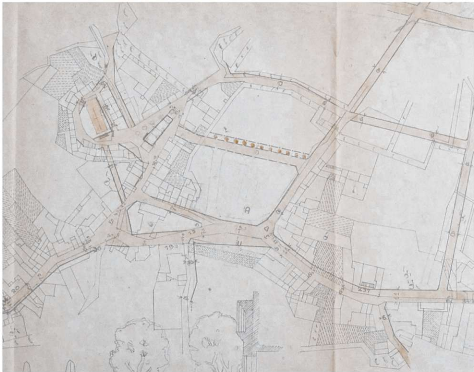
Fabianijev delni regulacijski načrt Solkana Zradirana cerkev – detajl z načrta