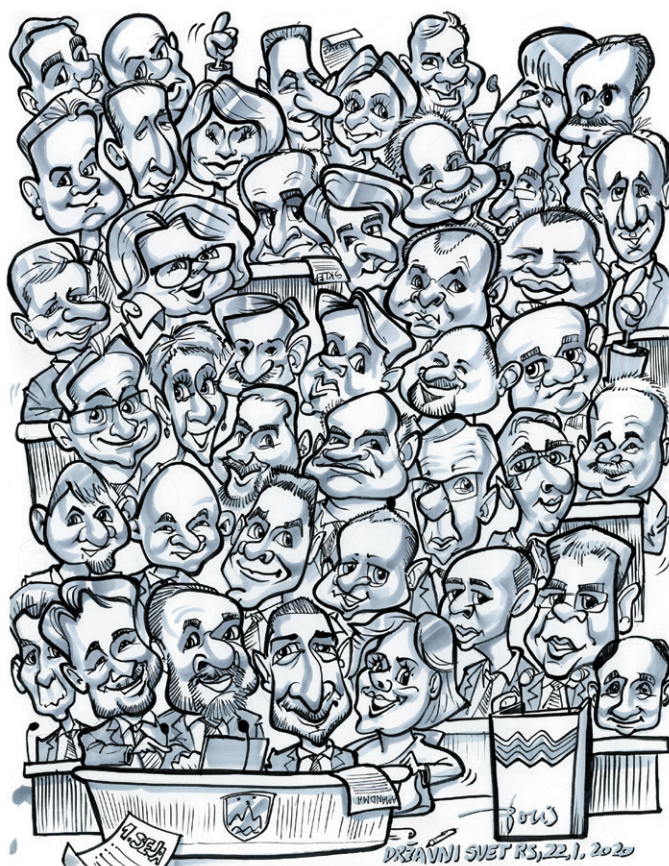
Boris Oblak, 2020

V letu 2019 je Državni svet na Vlado RS, ministrstva in druge pristojne institucije naslovil skupaj 83 vprašanj in pobud.