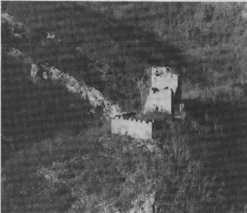
Trdnjava Pietra Pelose pri Buzetu