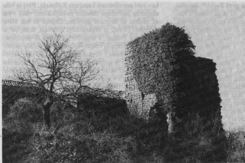
Glem — ostanki kaštela

no poudarjena zaščitna in oskrbniška funkcija za podeželsko prebivalstvo. 101 Leta 1592 namreč zasledimo, da je 500 mož iz koprške občine, ki so bili prej pod poveljstvom glavarja Slovencev, pod kapetanom Avgustom Callegarijem, 102 v naslednjih letih pa pod Bernardom Borisem. 103 Verjetno je bila ta sprememba povezana z ukazom Senata z dne 29. junija 1593, ki je podredil vseh šest kapetanatov črne vojske v Istri regimentu v Kopru, 104 kar je bilo odločilno pri dokončnem izoblikovanju našega mesta v upravno prestolnico dežele, ko s pomočjo Benečanov postane konec 16. stoletja deželni fevdalni gospod, kar si je želel postati vsaj od 10. stoletja naprej, čeprav s priokusi grenkobe, ki se je izkazala tudi ob uporih v 17. stoletju in nenazadnje leta 1797.