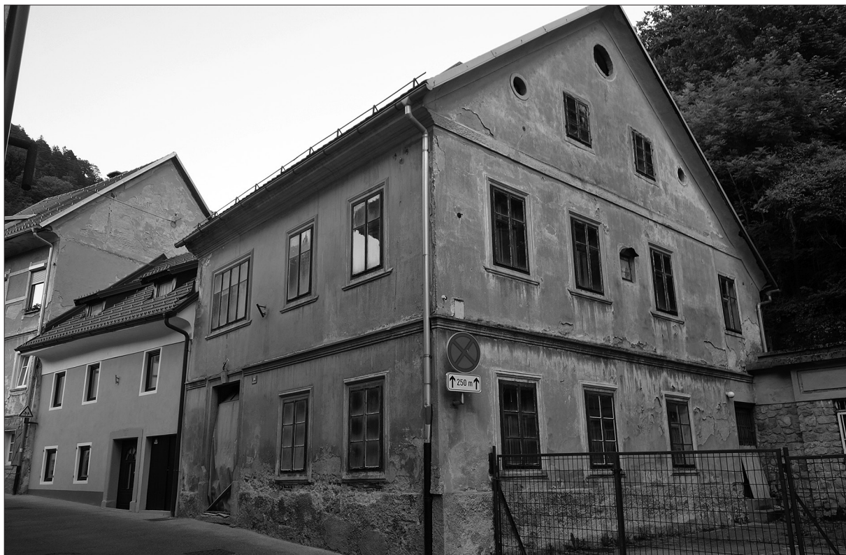
Nekdanja Grossova hiša v Tržiču.