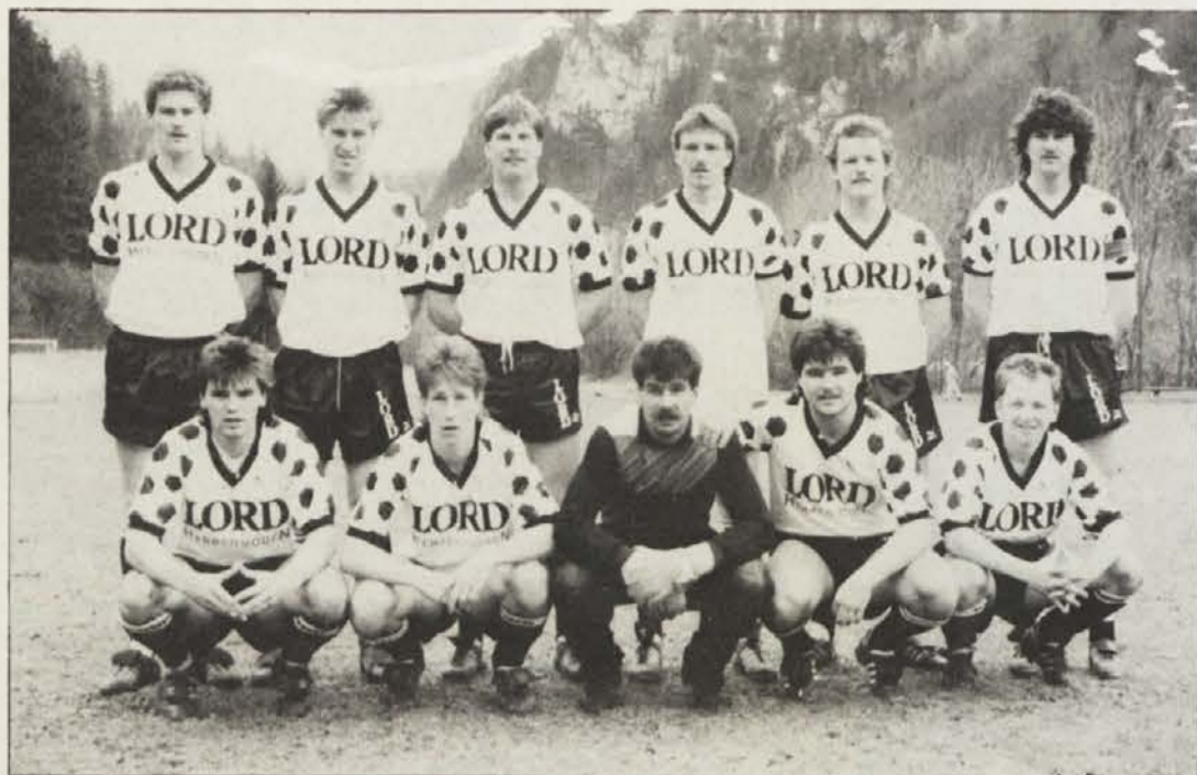
Železna Kapla (na sliki) je tokrat zapravila zmago in boljšo uvrstitev.