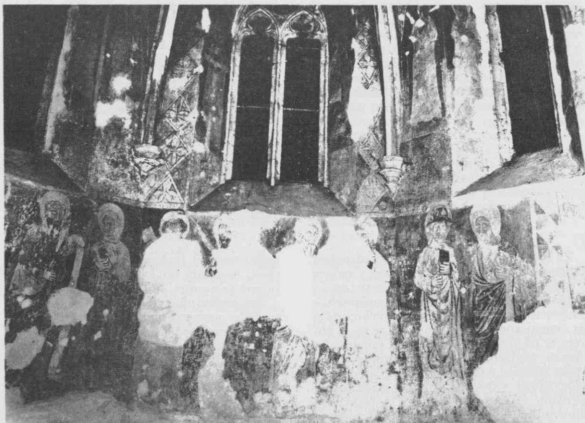
Murska Sobota, župna cerkev sv. Nikolaja, slikarije v starem prezbitteriju, okoli leta 1390

Prvi izrazitejši madžarski vpliv se kaže že v obdobju romanike. Po pritegnitvi mejno-obrambnega pasu v madžarsko civilno in cerkveno upravo, tam ob koncu 11. stoletja, kajpak pa tudi v celem 12. stoletju, ne najdemo nobenih konkretnih spomenikov. Izjema je seveda Sobota, kjer naj bi, kakor sporoča vizi-tacijski zapisnik iz leta 1698, že leta 1071 stala cerkev »ab antiquis catholicis«. 2 Seveda smemo domnevati tudi druge na ozemlju Prekmurja še pred 13. stoletjem nekatere sakralne spomenike, predvsem v pražupnijskih centrih. Med najstarejše prekmurske srednjeveške spomenike uvrščamo cerkve v Domanjševcih, Turnišču in Selu. Domanjševsko romansko cerkev sv. Martina, nastalo domnevno v letih pred mongolskimi vpadi 1241-42, zaznamujejo arhitekturne prvine, ki se pogo-