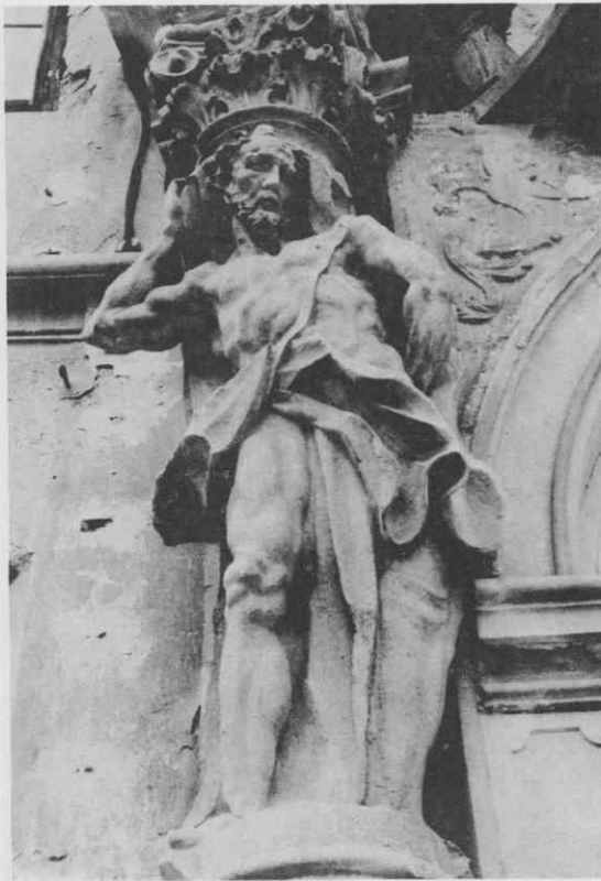
Murska Sobota, skulptura atlanta s portala soboškega gradu, l. polovica 18. stoletja

cerkvah v Veleméru, Nedelji pri Gornjih Petrovcih, Gornji Lendavi (Gradu) ter seveda v Soboti in Sv. Juriju. 9