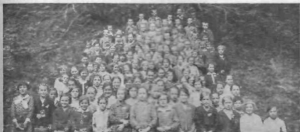
Marijin vrtec na Brezovici.