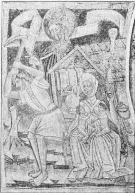
ADAM IN EVA PO IZGONU IZ RAJA. Freska v Hrastovlju, iz leta okoli 1490, odkrita leta 1951.

Na drugi strani ladje je Mrtvaški ples, največja znamenitost Hrastovelj, čas slovesa, Smrt, ki vodi za roko cesarja in papeža... kralja in škofa... meščana in berača... in tudi otroka, ki mora iz svoje male postelje.