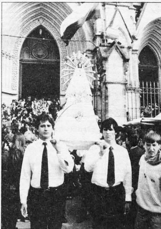
Pričetek procesije: slovenski fantje nosijo iz bazilike kip lujanske Marije, ki bo meseca junija ustoličen na Brezjah.