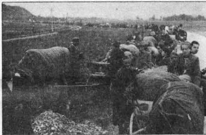
Iz Kranja proti Naklem.

Vsak človek je navezan na svoje korenine: na svoje starše, rod, zemljo in narod. V ta okvir je postavljen od rojstva, tu živi in deluje, tu je njegov dom. In če se mora ločiti od vsega tega, mu ni lahko. Tudi če gre stran prostovoljno, gre nerad in se vedno povrača v svoje rodno okolje, vsaj v spominih in željah. Domovina ali očetnjava zanj nista prazni besedi. Še huje pa je, če je kdo prisiljen, da zapusti domači kraj, dom in ves kulturni krog, ki mu je dajal živeti v duhu in telesu.