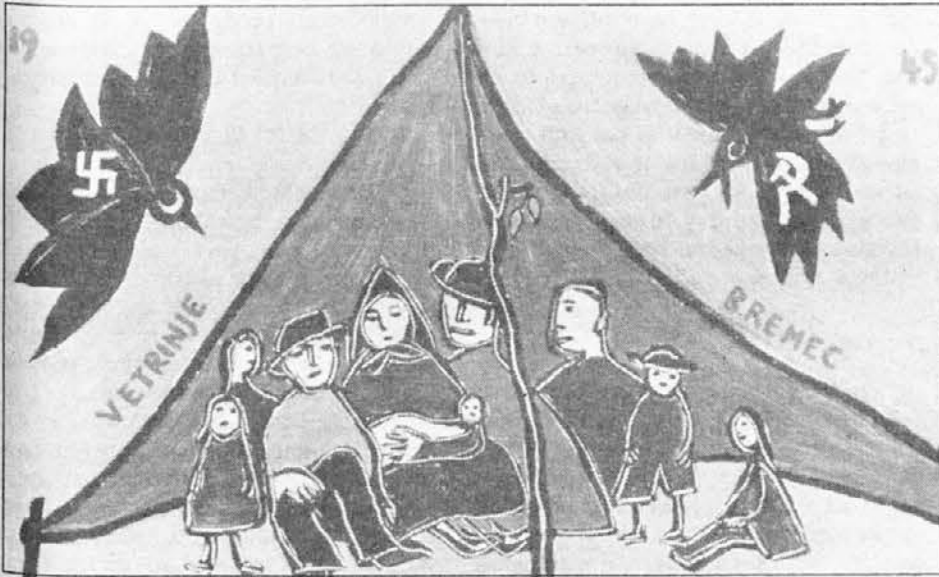
B. Remec: Vetrinje — panjska končnica