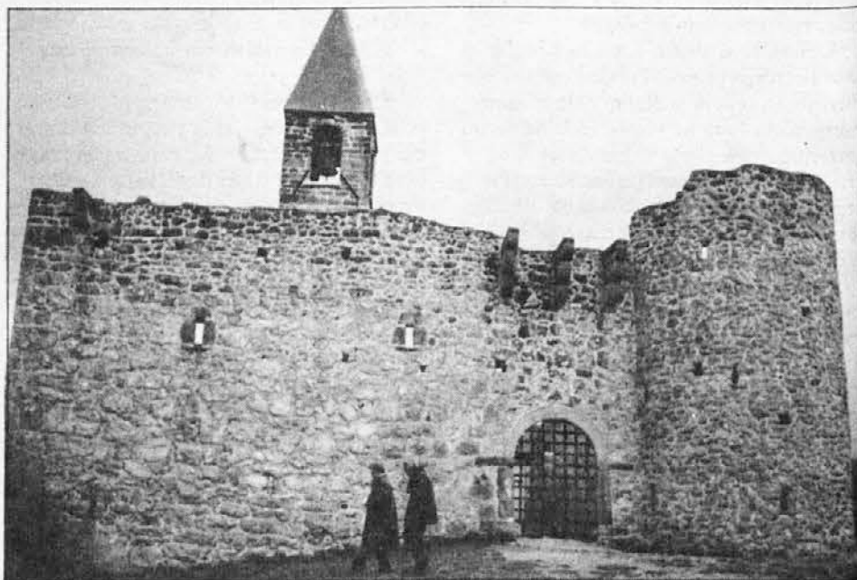
Zgoraj: srednjeveška cerkev v Hrastovlju.

Spodaj: znamenita freska MRTVAŠKI PLES iz l. 1490, delo Janeza iz Kastva.