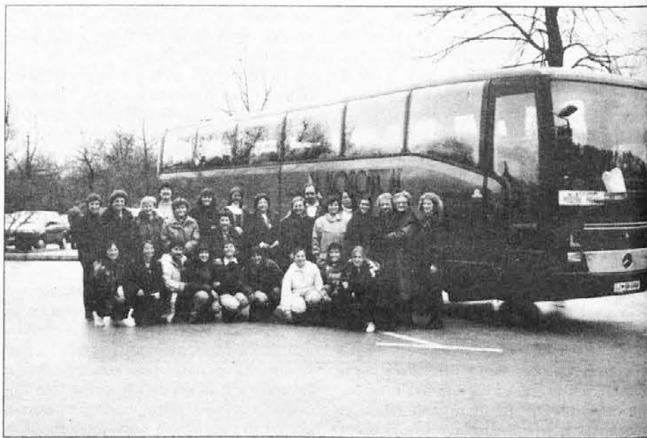
Učiteljska skupina s svojim omnibusom in šoferjem v Postojni.

Prišle smo čez Ruski most, ki so ga zgradili Rusi med 1. svetovno vojno. Pot nas je vodila v Špagetno dvorano. Ime je dobila po drobnih stalaktitih, ki visijo s