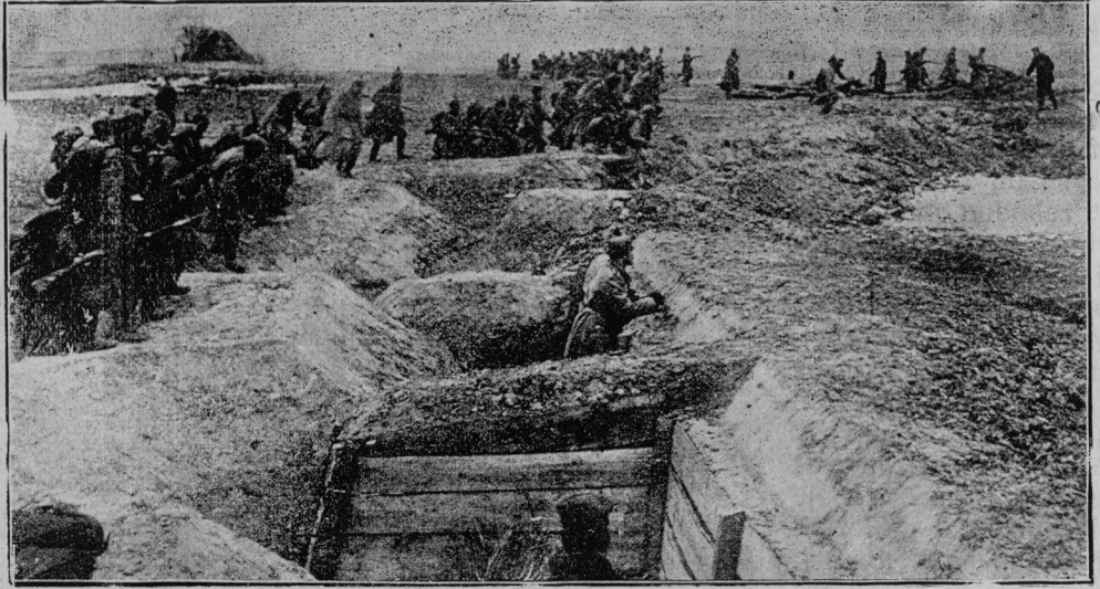
Ruski strelski jarki na Poljskem.

Peter Veliki je res poslal rusko vojsko na Poljsko, odkoder se ni hotela več umakniti, čeprav je kralj Avgust odstranil saške vojake. V Poljski je vladal ruski poslanik kot carjev namestnik. Po Avgustovi smrti so izvolili poljski magnatje iznova Stanislava Leščinskega za kralja (1733), ker je imel zaslonbo v Franciji. A Stanislava nista hoteli priznati Rusija in Avstrija; zato je izbruhnila med Francijo in Avstrijo poljska prestolonasledstvena vojna (1733—1738), Rusi pa so na poljski prestol posadili Avgustovega sina, Avgusta III., ker je Rusom odstopil Kuronijo. Stanislav Leščinski je nato drugič pobegnil! Avgust III. (1734 do 1763) sploh ni hotel živeti med Poljaki, nego je prepustil vodstvo državnih poslov ministru Nemcu Brühlju! Poljska se takratnih vojn ni udeleževala, vendar so sovražne vojske pustošile po deželi, kakor da bi ne imela nobenega kralja. V avstrijsko-rusko-turški vojni so korakali Rusi čez Poljsko in v 7-letni vojni so taborili Rusi stalno na Poljskem ter se obenem bojevali s Prusi. Državni zbor sploh ni več deloval. Magnati