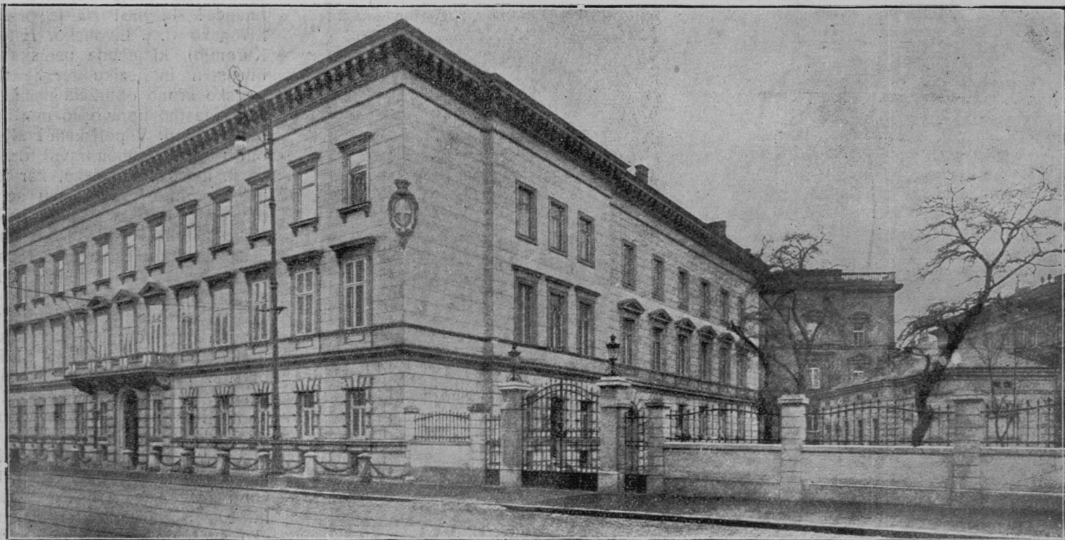
Vladna palača v Varšavi.