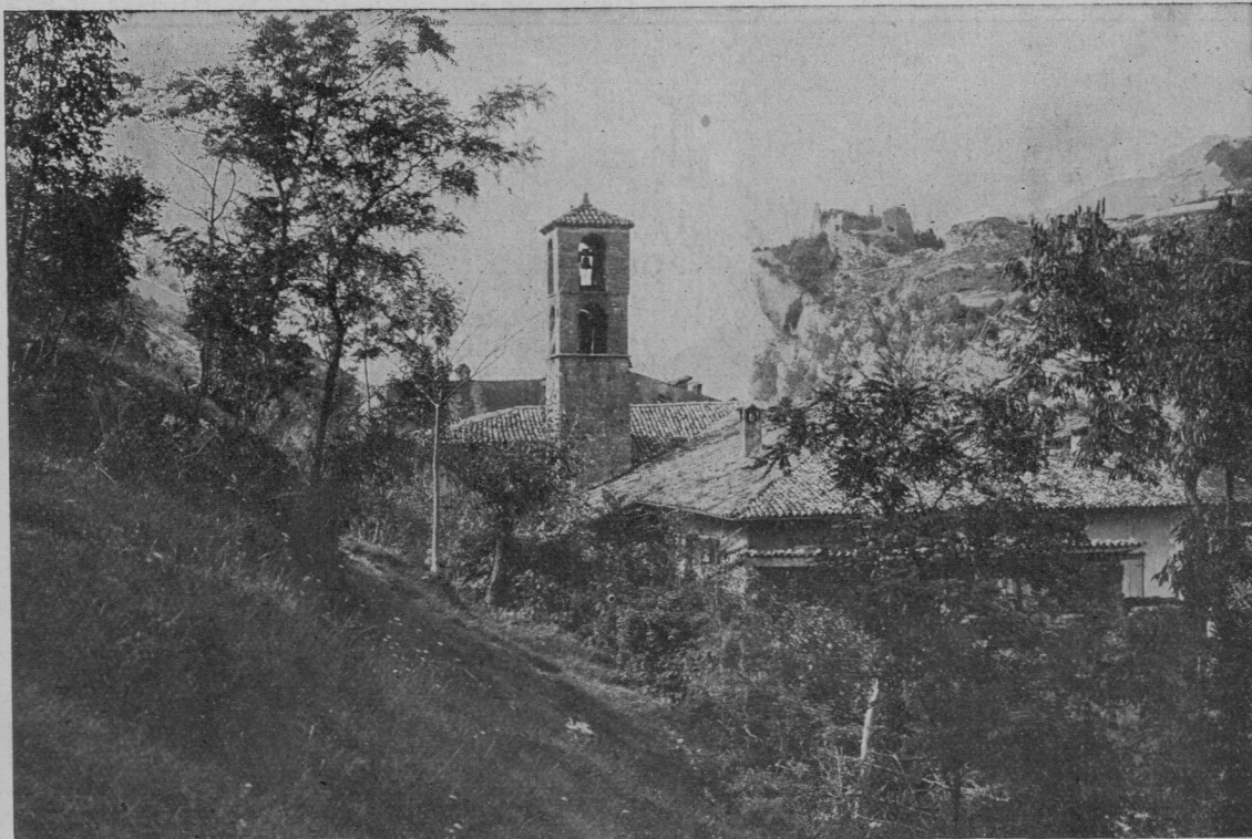
Cerkvica in razvaline gradu v Mori ob Adži v južni Tirolski.

Ko je umrl zadnji Jagjelovec brez moških potomcev (1572), so se začeli boji raznih kandidatov za trhli poljski prestol. Plemstvo se e prodajalo tem kandidatom ter je izsiljevalo denar pri vseh. Ker je bil Henrik Valois, brat francoskega kralja Karla IX., najbolj radodaren ter je plačeval največjo podkupnino, so poljski velikaši l. 1573 izvolili njega za poljskega kralja. Ta francosko-poljski kralj je zajamčil versko svobodo ter je dovolil, da senat (t. j. velikaštvo) po svoji volji začenja vojno ali sklepa mir ter da se le z