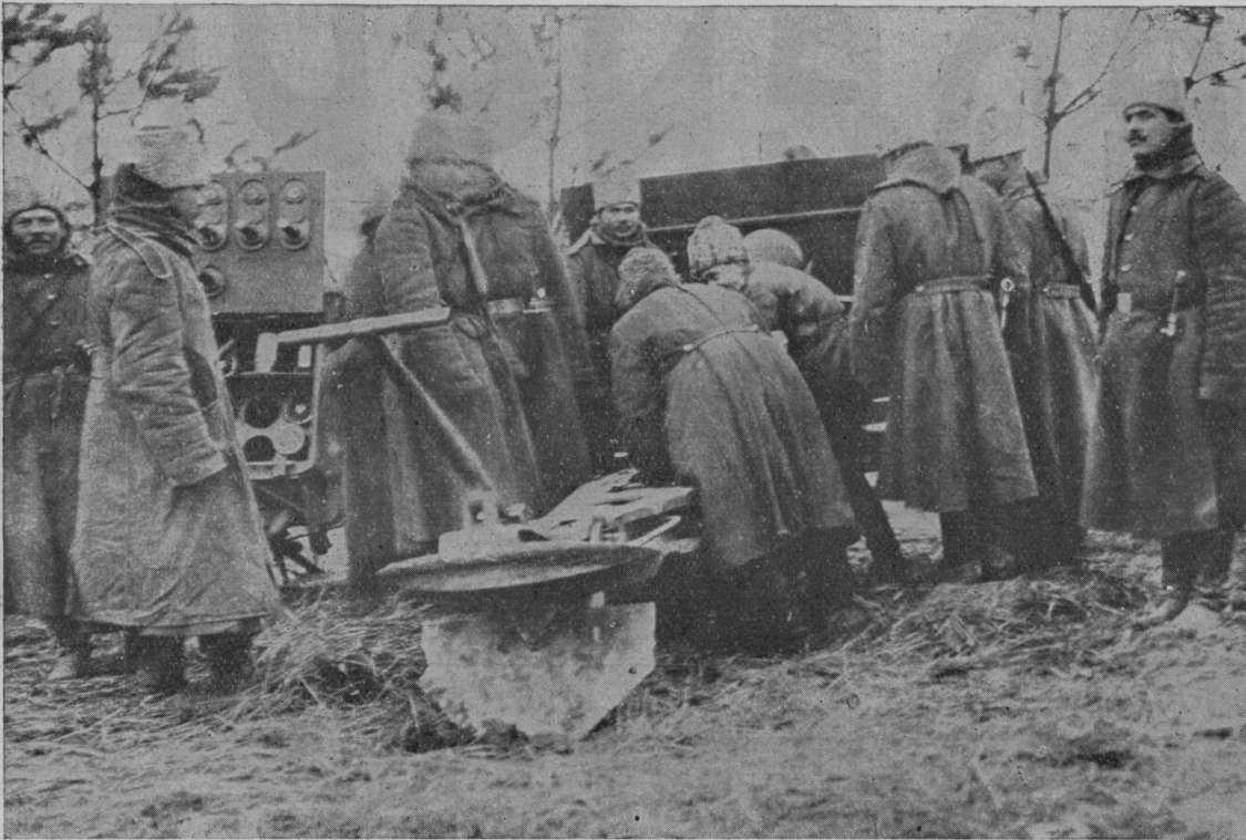
Kako je pri ruskih topničarjih. To fotografijo so našli pri ujetem ruskem vojaku.