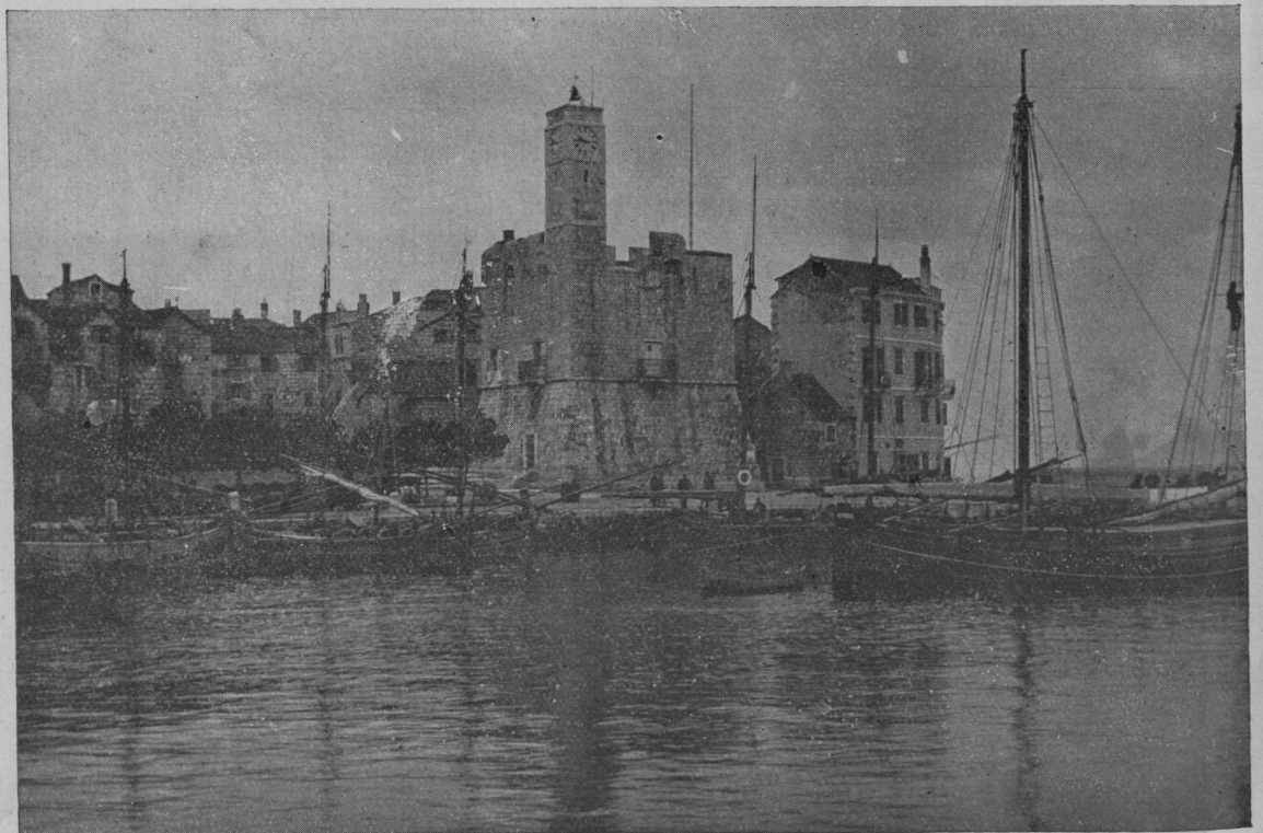
Castelnuovo v boki Kotorski.

No, naslikal sem ti vso zadevo nalašč precej mračno, da je ne smatraš za malenkostno. Tvoja pravda bo senzacija! Delikatesa za žurnaliste! Razume se, da se hoče-