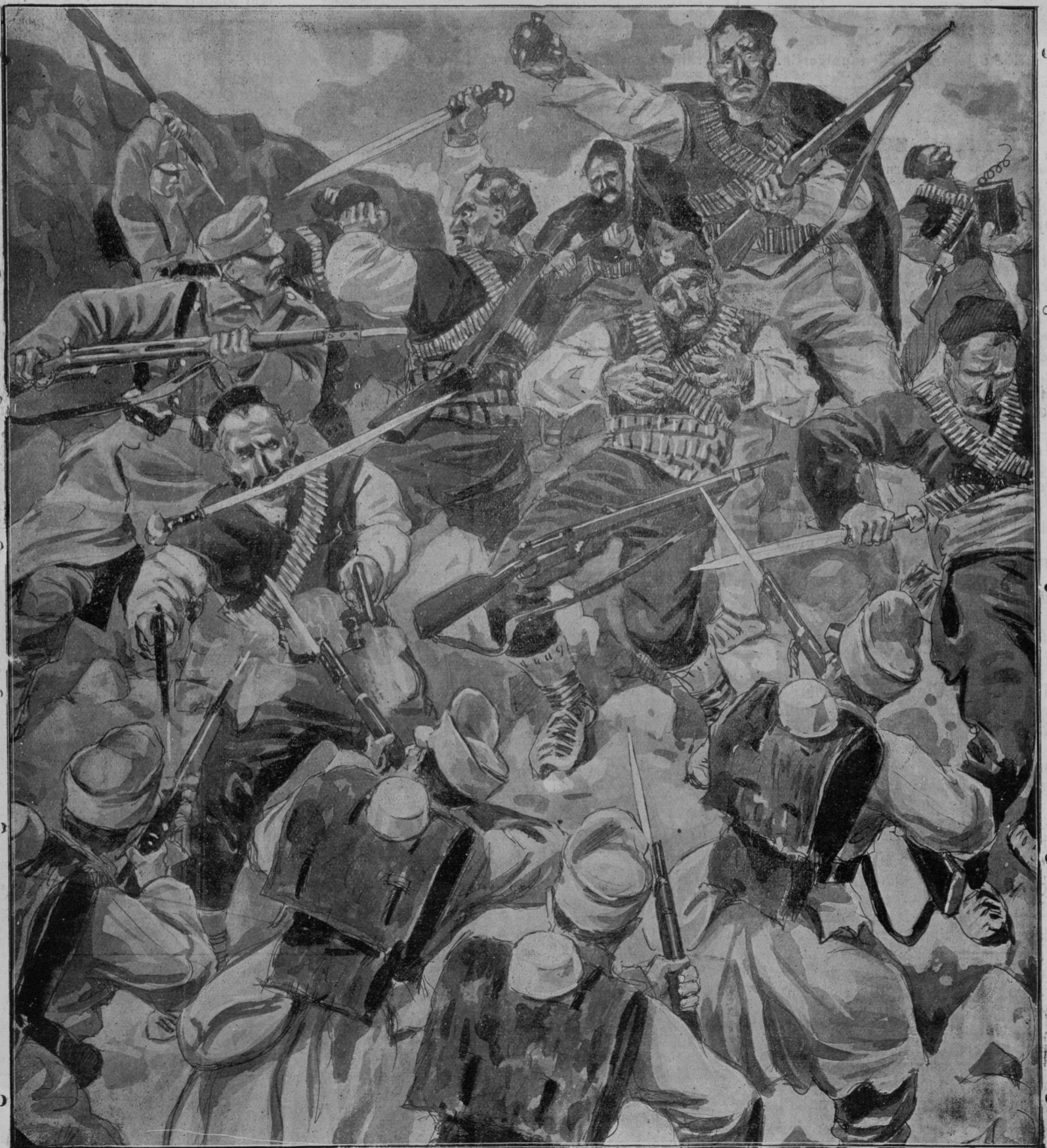
Iz bojev na hercegovsko-črnogorski meji: Borba dveh patrolj blizu Čajnice, pri kateri je bil predrzni napad Črnogorcev odbit z velikimi izgubami za napadalce.