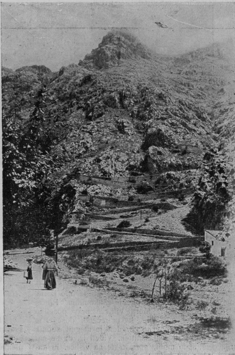
Cesta iz Kotora na Lovčen in Cetinje: Torišče bojev s Črnogorci.

zaki, ki so se zvezali s Tatarji in Turki proti Poljakom. Poljaki so se zopet utapljali v krvi in vsa vzhodna Poljska je bila eno samo pogorišče in morišče. Bogdan Hmeljnicki je osvojil tudi Lvov in pol današnje Galicije ter nato povabil ruskega carja Alekseja, naj zasede Ukrajino. Car je zagotovil kozakom vse njih svoboščine, samoupravo in lastno sodstvo. Tako je izgubila Poljska zopet veliko pokrajino zaradi