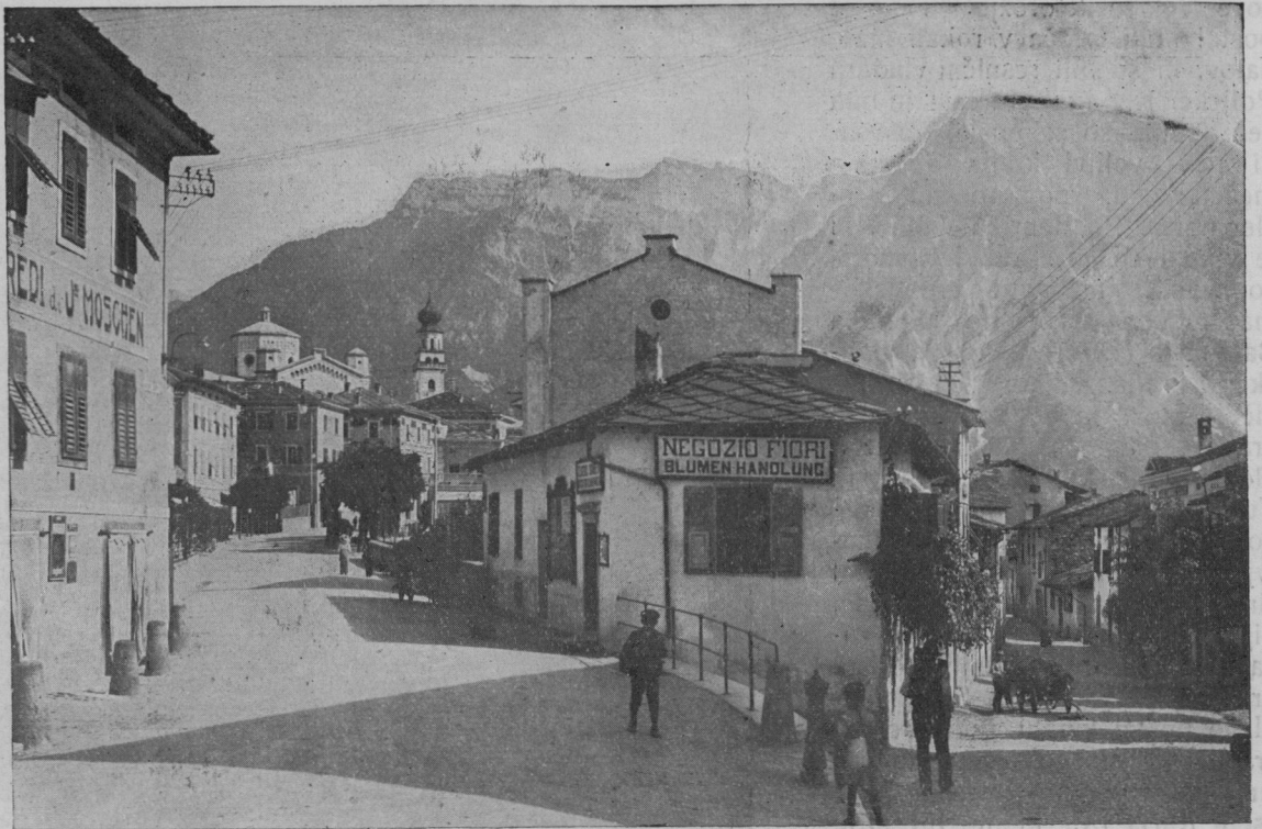
Glavna ulica v Levicu na južnotirolskem bojišču.

„Skoraj bi se bil zagovoril. Eskulapovi učenci ste — kakor Cezarjeva žena — vzvišeni seveda nad vsakršnim sumničanjem. Bila je samo hipna misel. Spoštovanega Pennyfeathra so brezdvomno vodili najpo-