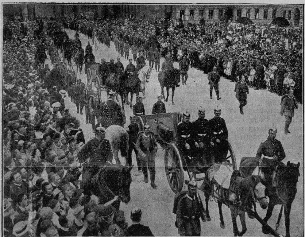
Pohod nemške armade skozi Varšavo.

bližali, ozemlje pred nami tembolj obstreljevali, smo se jim mogli približevati le kora-