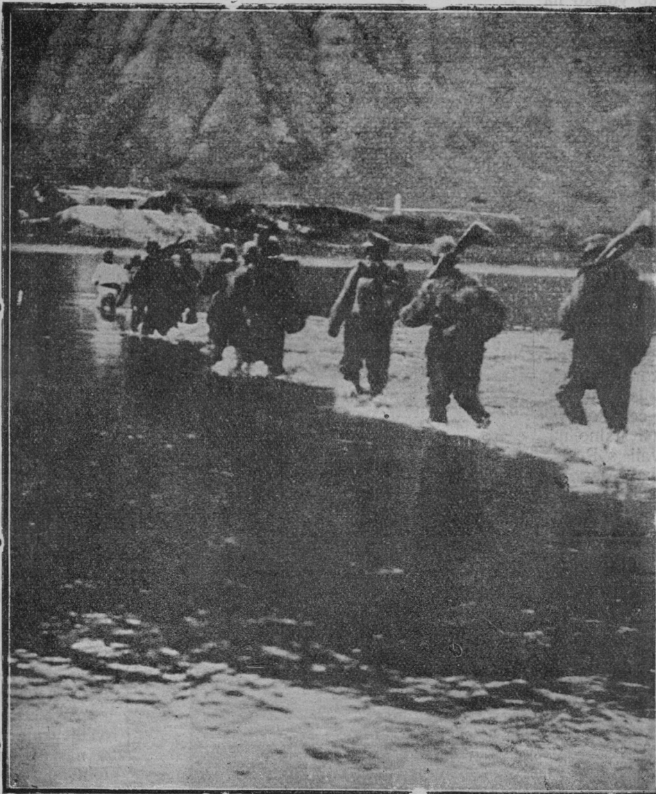
Prehod naše vojske čez Dnester.

V Veroni so se pojavila avstrijska letala, ki so imela ogrske zastave, katere