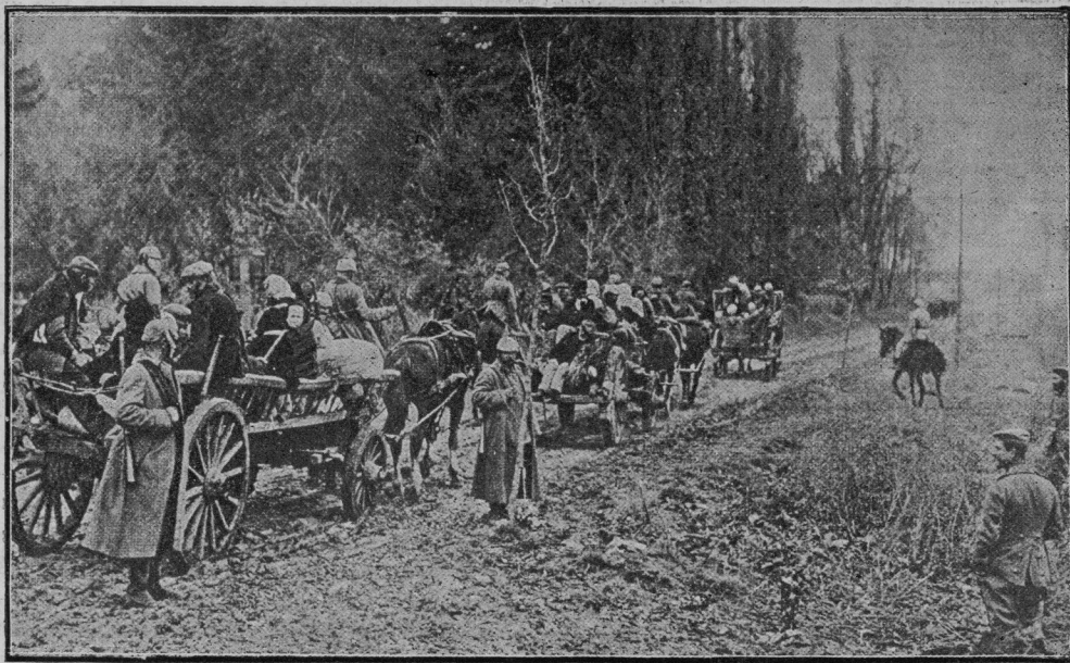
Poljski begunci se vračajo pod zaščito nemških vojakov v svoje opustošene vasi.

Predvčerajšnjim in včeraj smo imeli zopet krvave boje z Lahi. Grmelo je tako, da drug drugega nismo čuli. Le z znamenji smo se sporazumeli. Morda poznaš dober-