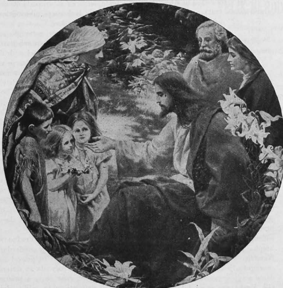
PUSTITE MALE K MENI.

Daj močno dušo, Gospod, mi, pogum mi daj, da, kadar nedolžen trpim, v odgovor kažem svetu brezbrizen smehljaj in mirno, ponosno molčim.