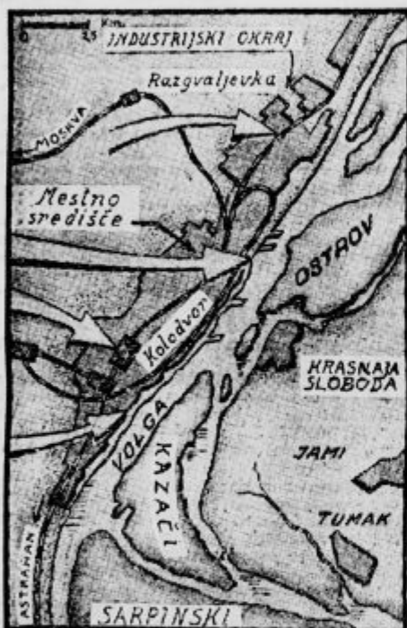
Caricin (Stalingrad) z okolico

Tatari imenujejo Volgo »litla«, kar po naši pomeni velikodušen, radodaren. Toda to ime ji niso dali zaradi velikega prometa in ogromnega števila velikih in majhnih mest ter na tisoče vasi, ki leže na njenih bregovih, temveč zaradi neizčrpane množine rib, ki jih hrani v svojih vodah. Njena delta ob izlivu v Kaspisko morje je eden najbogatejših predelov sveta. Ribja industrija zaposluje v tem predelu 50.000 delavcev in odpremi na trg letno 500 milijonov kilogramov rib.