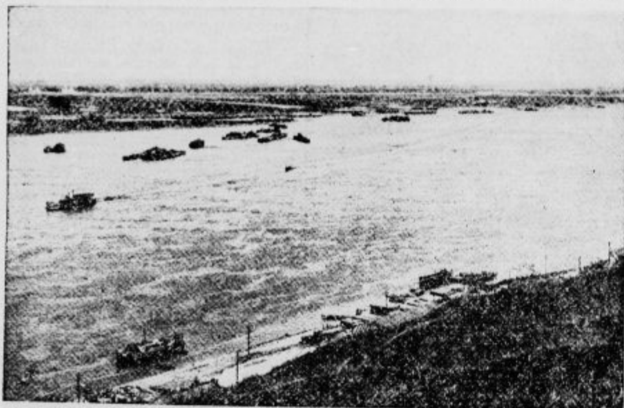
Volga pri Nižnem Novgorodu