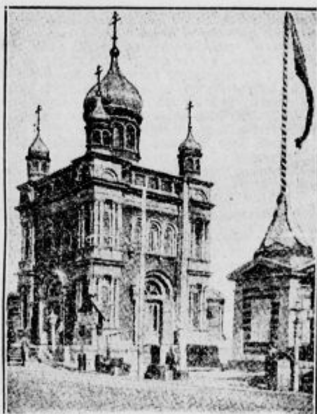
Ena izmed cerkva v Nižnem Novgorodu