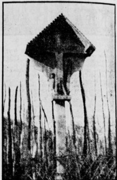
Od partizanov oskrunjen »Golobičev križ« v Kalu pri Semiču

Po svoji izobrazbi in sposobnostih je najbolj spadal na mesto ravnatelja stanovske šole v Ljubljani, najbolj od vseh, kar jih je bilo v tej službi, kajti visoko je prekašal svoja dva prednika Lenarta Budina in Adama Bohoriča, pa tudi svoja naslednika Praenteliusa in Engelberta Engla. Izredno vneto se je zavzel za zboljšanje slovenske šole v Ljubljani, sestavljal zanjo nove učne načrte, pridobil slovenščini večjo veljavo in rabo v tej šoli in bil vsaj posredno začetnik slovenske šolske dramatike. Le to je bilo škoda, da je bival samo dve leti pri nas; in zato se ni mogel še v zadostni meri poglobiti v bistvo in lepote našega jezika, pa tudi vseh svojih koristnih načrtov za slovensko šolstvo in dramsko pesništvo še ni utegnil izvesti. Pa že to, kar je storil, je dovolj, da se ga spomnimo tudi v našem pregledu zaslužnih mož.