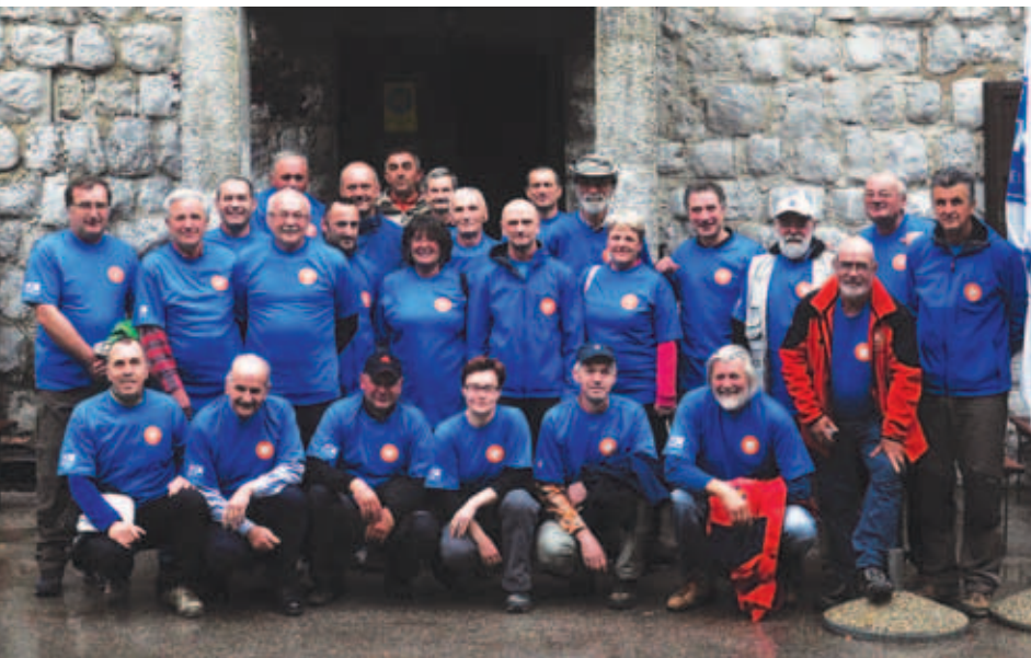
Po opravljenih izpiti.

Vodniška služba je strokovna prostovoljska služba Hrvaške planinske zveze (HPS), ki skrbi za organizirano vodenje po planinskih območjih Hrvaške. Vsa strokovna vprašanja vodniške službe ureja Komisija za vodnike HPS, pri kateri sta organizirani še dve podkomisiji: za šolanje in vodnike društvenih