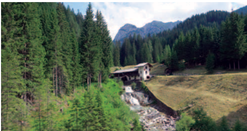
Ob izviru reke Piave.