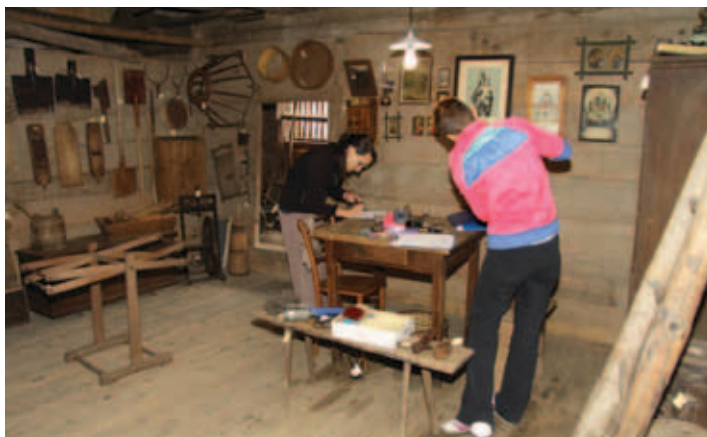
Mlada udeleženca etnološke delavnice.