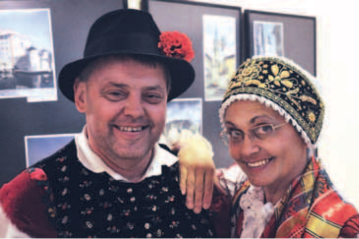
Eli in Nenad.

V organizaciji kulturno-umetniškega društva Zvir iz Jelenja je v nabito polni dvorani Doma kulture pod naslovom Drmeš – DA! potekalo tekmovanje folklorno-plesnih parov v narodnih plesih. Ta enkratni projekt je nastal na Hrvaškem, njegov cilj pa sta ohranitev in promocija hrvaških narodnih plesov.