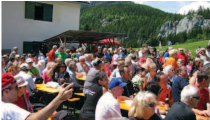
Množica udeležencev.

Slovensko planinsko društvo Celovec, Slovenska športna zveza in Slovensko prosvetno društvo Zarja iz Železne Kaple so v Podpeci pri Železni Kapli organizirali 42. srečanje obmejnih planinskih društev. Srečanja so se udeležili PD Jesenice-SPD Gorica, PD Benečija-SPD Trst, SPD Celovec, PD Gorica in planinska skupina KPD Bazovica. Tako je srečanje treh dežel preraslo v srečanje štirih dežel.