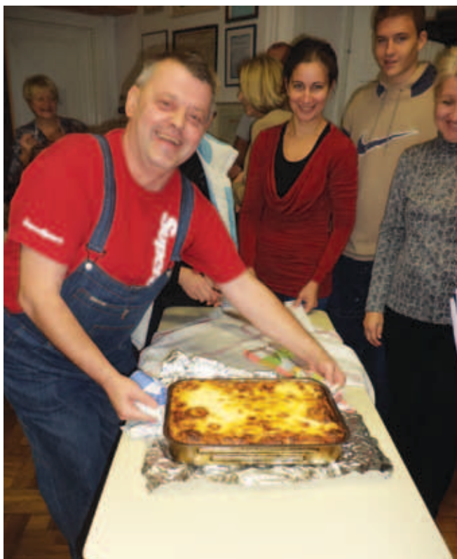
...in pečemo.