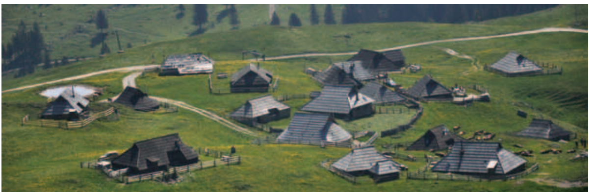
Veliki stan na Veliki planini.

Dan slovenskih planincev je za Rečane pomenil tudi navezovanje novih stikov pa tudi srečanja s številnimi planinskimi prijatelji iz Obalnega PD iz Kopra, PD RTV Ljubljana, SPD iz Trsta in drugih društev, s katerimi že dolgo sodelujejo in načrtujejo skupne akcije. Če ne prej, se bodo vsi skupaj spet srečali na začetku jeseni na Velebitu. Darko Mohar