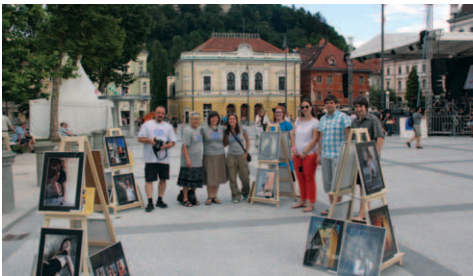
Člani društva v Ljubljani.