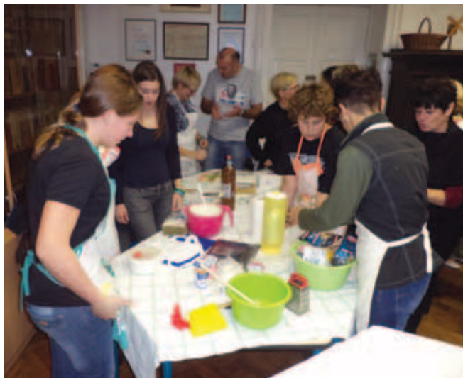
Pri pouku tudi kuhamo ...

Veliko udeležencev vztraja pri pouku več let. Večina želi isto pot nadaljevati tudi prihodnje šolsko leto. Iz naključne skupine posameznikov, ki so prišli k pouku pred tremi leti, se je oblikovala skupina, lahko bi jo poimenovali "slovenska skupnost", ki živi in ustvarjalno ohranja slovenščino živo ter skupaj oživlja in ohranja živo slovensko kulturo. To pa je cilj DPS v tujini.